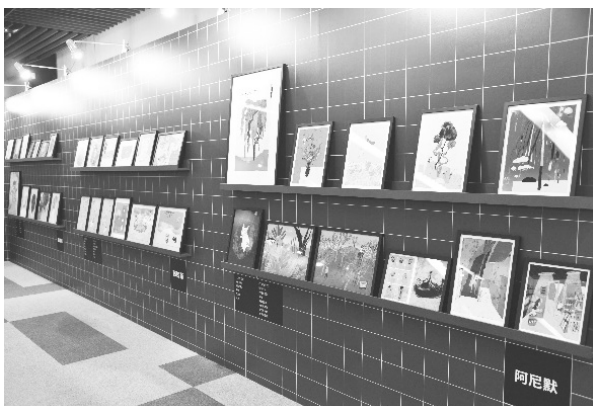
「Visual Fanzine — 台灣創作者交疊的圖像風景」特展 現場（112 年 7 月 20 日）