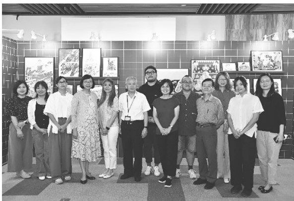
「Visual Fanzine — 台灣創作者交疊的圖像風景」特展 國家圖書館曾館長與貴賓合影（112 年 7 月 20 日）

上午 10 時至 12 時，在 3 樓國際會議廳辦理 3 場講座，特展現場辦理 1 場專家導覽，藉由創作者分享經歷與觀點，傳遞圖像作品與日常生活的連結，描繪出屬於這個島嶼所集結而成的豐富色彩。