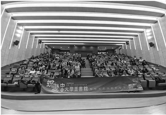
圖 25 109 學年度全國大專校院圖書館館長聯席會議