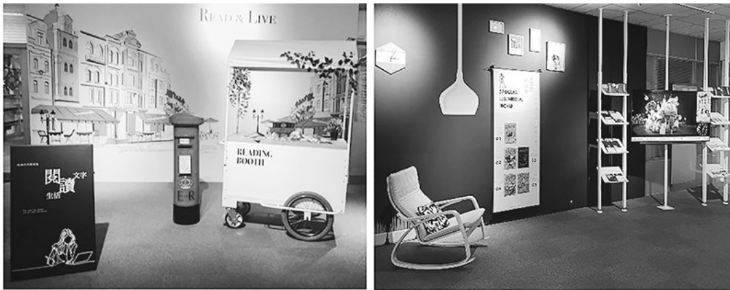
圖 17 國立中興大學圖書館梯廳活化改造

(二) 國立成功大學圖書館：回應學生會的祈禱需求，於 9 月 24 日正式啟用「祈禱與靜心區」(Prayer and Meditation Space) 新空間。臨窗打造角落空間，以自然採光、木造地板、柔和光線立燈、原木傢俱等，營造舒適溫馨的場域氛圍；擺置活動屏、各式坐墊、地墊與祈禱墊等，提供多元文化背景與信仰及追尋靜心的國內外學生安心學習的圖書館環境，同時也達到沉靜、減壓與滿足跨信仰 (interfaith) 祈禱功能。