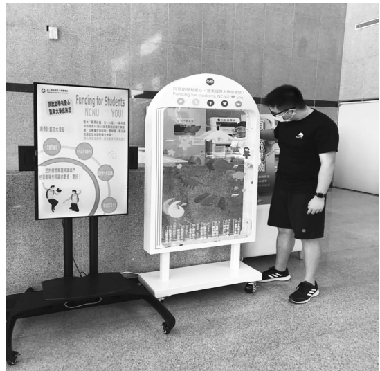
圖 24 國立暨南國際大學圖書館捐款助學彈珠檯募款箱

(五) 國立暨南國際大學圖書館：設置捐款助學彈珠檯募款箱，增加校內師生及校外人士捐款協助該校辦學的管道，鼓勵弱勢學生進入在地國立大學就讀，促進社會流動並提供弱勢學生多元升學管道。