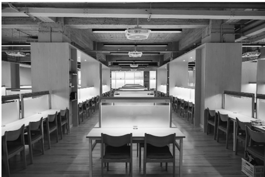
圖 21 東吳大學雙溪總館第一閱覽室