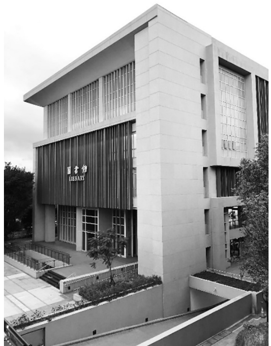
圖 20 臺北市立大學博愛校區圖書館原址改建新館

校長及傑出校友；三樓「麟洋廳」以 2020 年東京奧運羽球男子雙打金牌校友王齊麟與李洋命名，提勉莘莘學子勇於追夢的努力與堅持；新館亦保留展示舊館修澤蘭設計的「空心花磚牆」及「木格柵」，窺見昔日建築之美，傳達新舊傳承。