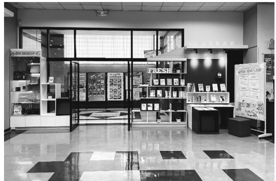
圖 22 朝陽科技大學圖書館二樓主題書展區