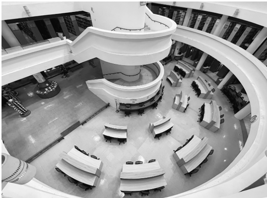
圖 19 國立臺北護理健康大學圖書館一樓寰宇閱覽室