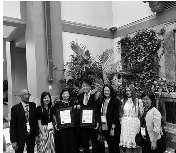
本年度創新獎項獲獎國家圖書館 (左 3) 及韓國首爾大學圖書館代表 (中) 與 ALA 主席 (右 3) 合影