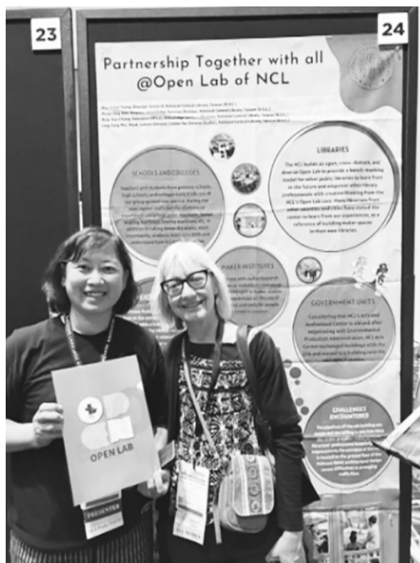
與參觀海報國際館員合影

本次 ALA 年會主題對於禁書及多元文化的議題討論非常熱烈，透過分享、交流讓世界各國圖書館員了解對於知識自由及多元文化議題更廣的認識。從開幕活動的專題演講到各小組工作討論會上，一再鼓勵圖書館員們應支持反對圖書禁令、呼籲圖書館員改善圖書館空間和資源的無障礙性、分享了各地圖書館及出版作者為種族、性別、教育、社區服務等相關創新作法，也為未來圖書館的服務提供了方向。