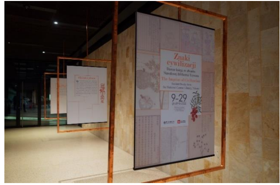
波蘭國家圖書館「文明的印記：古籍文獻展覽」現場