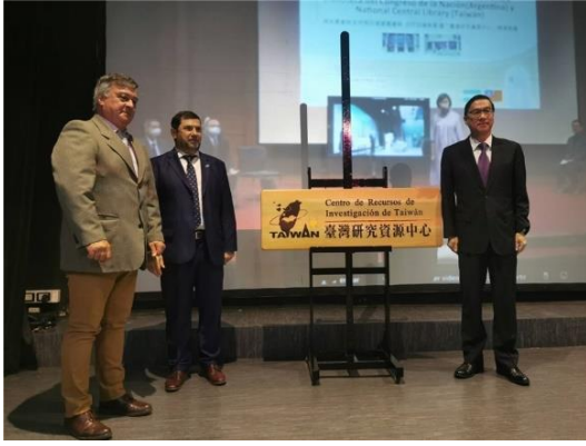
揭牌儀式完成