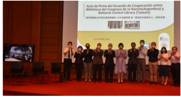
阿根廷現場學界、政界、僑界、館員等齊聚一堂見證台阿學術合作的歷史時刻。儀式完成，國家圖書館同仁與貴賓向阿根廷現場來賓(左側螢幕)拍手致意