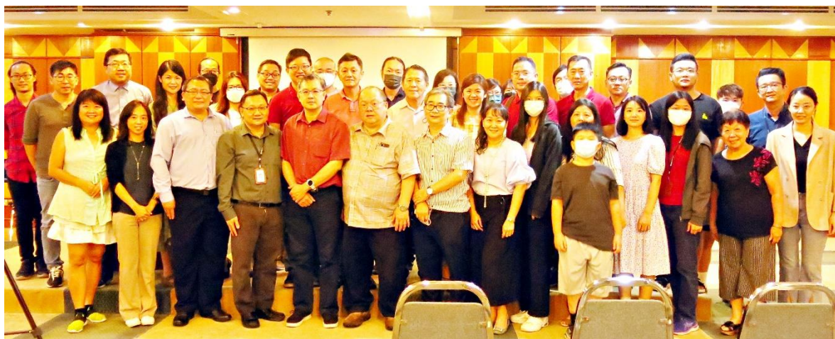
第 1 場講座現場大合照