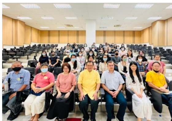
第 2 場講座現場大合照