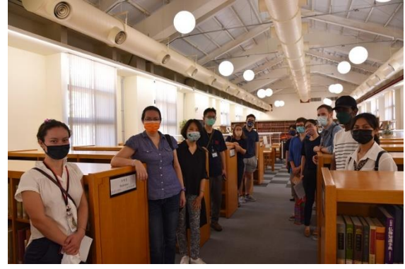
學員於故宮博物院圖書館合照