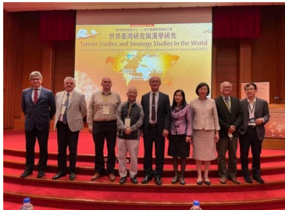
暨受邀講座學者合影