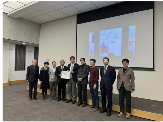
現場與會學者大合照