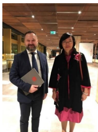
左起波蘭國家圖書館館長、國圖曾館長於展覽會場合影留念。