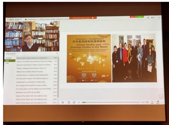
倫敦大學亞非學院羅達菲教授線上發表演說