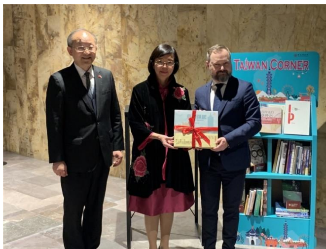
展覽開幕典禮上亦同步舉行 Taiwan_Corner 贈書儀式，曾館長代表贈送臺灣相關主題書籍予波蘭國圖。

習慣，並激發海外民眾學習中文的興趣及提升中文閱讀能力，更增加對臺灣的瞭解。此次為感謝波蘭臺北辦事處大力支持日前於中正紀念堂舉行的111年閱讀節活動，贈送 Taiwan Corner 以及 50 餘冊有關臺灣歷史民俗、自然生態、文學藝術等多元主題的圖書給波蘭國圖作為禮物，盼讓波蘭民眾更加認識臺灣。