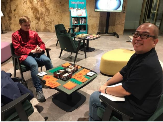
展覽互動體驗：吉祥卡的印製活動