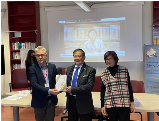
李新穎大使代表本館贈書

突顯國圖與「臺灣漢學資源中心」之間的合作關係，也讓臺灣學術活動能量、研究成果能夠在世界舞臺綻放。