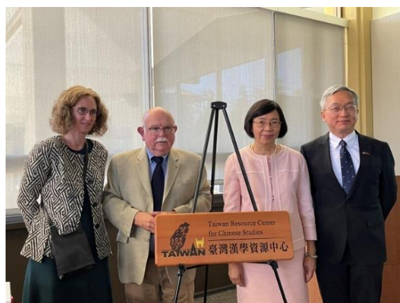
雙方代表共同為臺灣漢學資源中心揭牌、開放中心資源使用