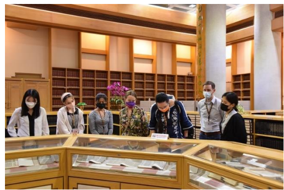
學員參觀善本圖書室