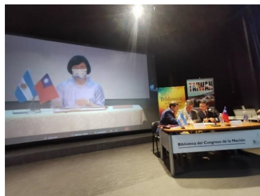
國家圖書館曾淑賢館長與阿根廷國會圖書館館長線上視訊同步簽署合作協議書