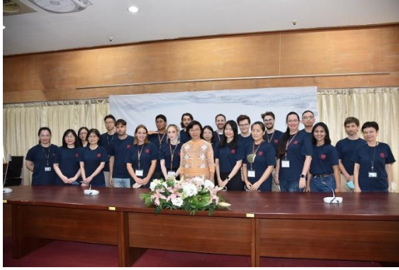
結業式全體大合照