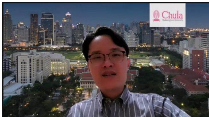
講者 Arm Tungnirun 博士

演講結束後的問答時間，線上聽眾提問踴躍。受到烏俄戰爭的影響，聽眾也關心美中的競爭關係是否會衍生臺灣與中國間的戰爭的發生，兩位學者紛紛認為未來情勢難以斷定，避免戰爭的發生是大家目前唯一的共識。