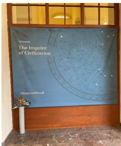
展覽主視覺打卡牆面提供民眾合影留念