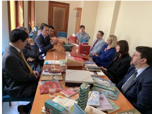
布拉格市立圖書館與國家圖書館兩館人員進行座談交流。