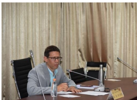
本場次講者戴維理教授

本年度寰宇漢學學友講座於 6 月 28 日下午舉辦，邀請本中心學友美國古徹學院歷史學副教授戴維理 (Evan Dawley) 演講，講題為「殖民地臺灣的民族形成 (1880s-1950s)：《成為臺灣人》出版之後的省思」，並邀請國立臺灣大學歷史學系羅士傑副教授主持。戴維理教授討論基隆當地的民族形成過程，這在其專著《成為臺灣人：殖民城市基隆下的民族形成 (1880s-1950s)》已有所審視。戴教授更進一步檢視本地人與日本菁英如何一起創造在地的城市認同，特別重視所謂的本島人之社會組織、宗教機構和節慶、福利領域以創立新的民族意識，並反抗日本和中國之國家認同強行置入。