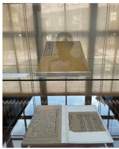
首次展出珍貴複製古籍《永樂大典》