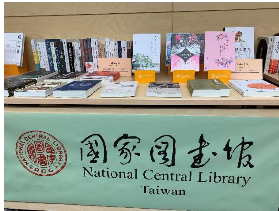
主題圖書展覽現場