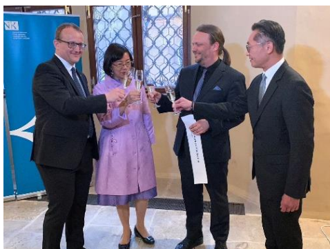
貴賓及館長們舉杯慶祝兩國文化盛

開幕當日有近百位嘉賓參與，精彩的展覽設計與豐富的展品內容，皆讓捷克民眾驚艷，Chrást 副部長等人，亦對於現場展出之珍藏古籍讚賞不已；展場提供的多色套印體驗，以及吉祥卡印製活動，都讓觀展民眾感受印刷術的趣味，深受好評。