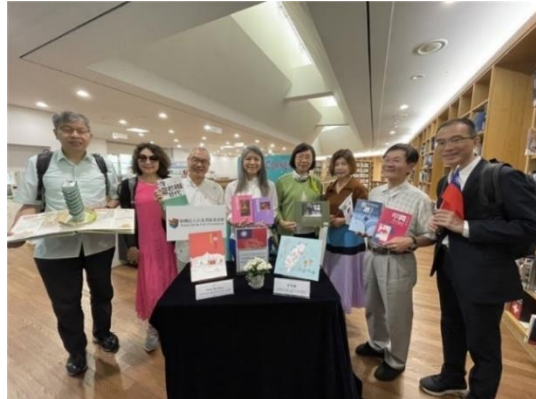
曾館長與 Seon_主任及台北書展基金會 2023 韓國出版考察團成員於 Taiwan_Corner 前合影