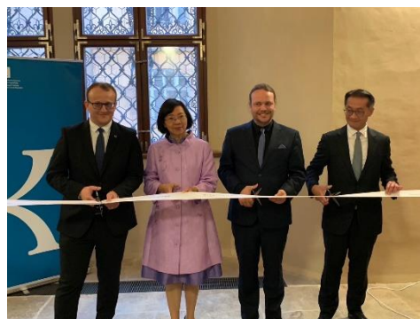
展覽由兩館館長、我駐捷代表及捷克文化部副部長共同拉開序幕