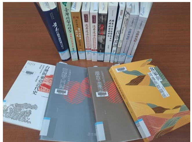
圖 3【建構漢學研究主題圖書-中文圖書】