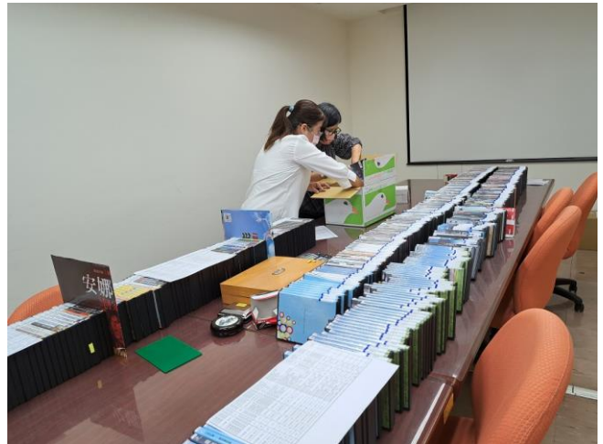
圖 8【視聽資料加工與分類裝箱】