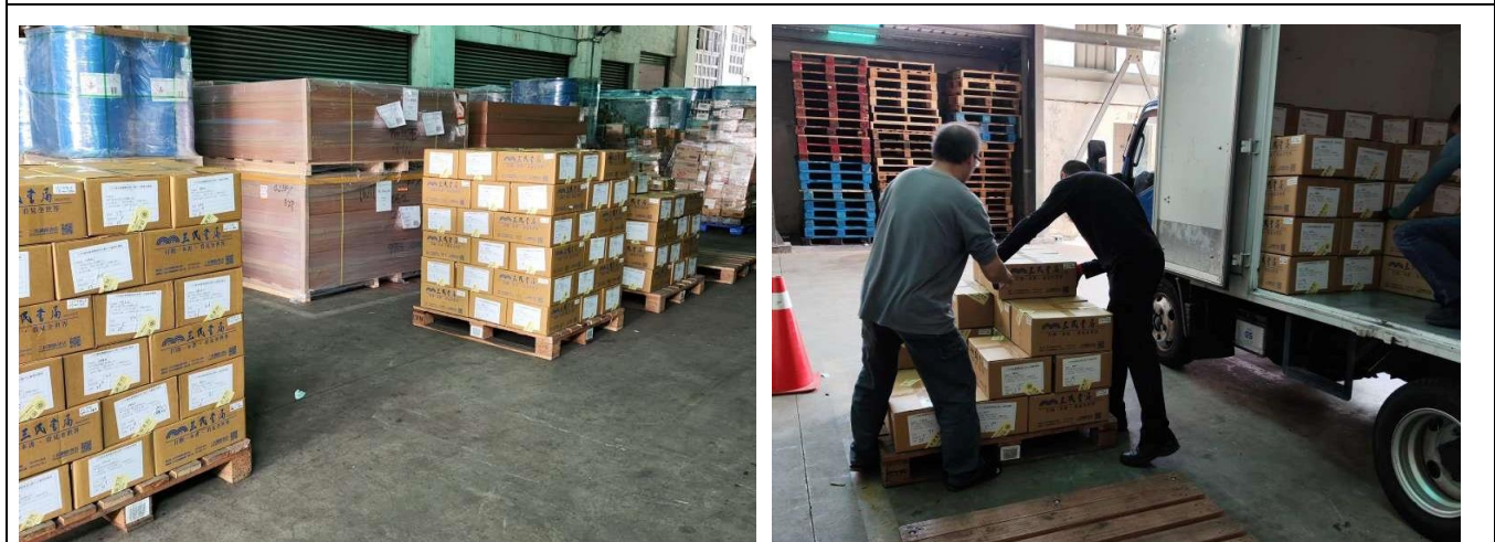
圖 6【採購圖書裝箱移送至倉儲暫存】