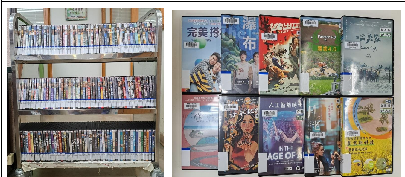
圖 7【充實南部分館視聽資料館藏】