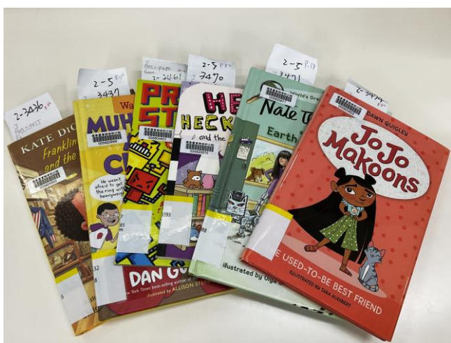
圖 4【建構分齡分眾閱讀資源-西文圖書】