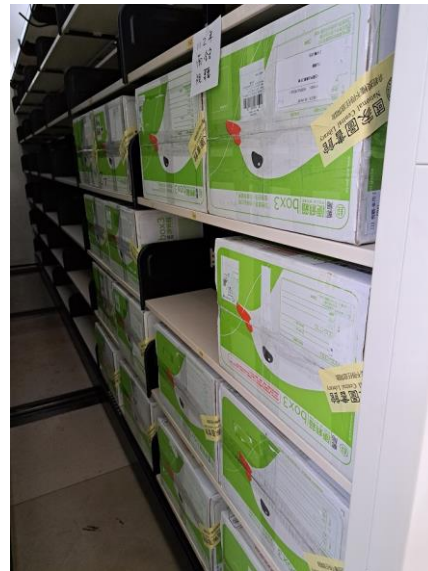
圖 9【視聽資料裝箱移至 B1 密集書庫存放】