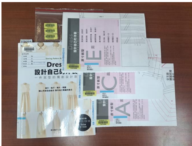
圖 2【加工範例-中文圖書】