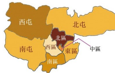
圖1-1 民國三十九年（1950）以後臺中市行政區域

日治時期的臺中市位於臺中盆地中部偏北的地方，東倚加里山脈南段的頭嵙山地，西枕大肚台地，清末劉銘傳認為其「地勢寬平，氣局開展，襟山帶海，控制全臺，實堪建立省會。」 [1] （見圖1-1 民國三十九年（1950）以後臺中市行政區域）