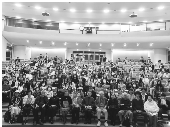
大合照（113 年 3 月 27 日）