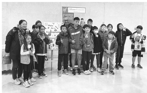
臺北市立大學附設實驗國民小學師生前來觀賞影展的第二部片《喜馬拉雅之花》(113年3月7日)