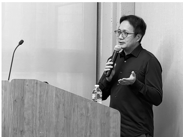
講者楊孟軒教授（113年3月4日）

演講結束後，聽眾對於此次講座安排都給予正面回饋，並表示對於臺灣戰爭創傷與記憶等議題上獲益良多。（漢學研究中心學術交流組吳信慧）