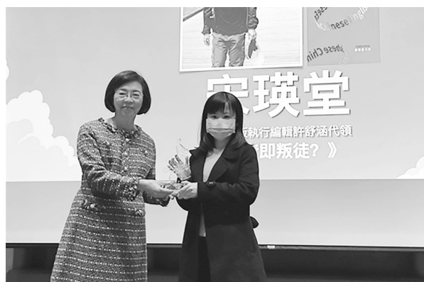
國圖前館長曾淑賢出席華文頒獎典禮 (112 年 12 月 17 日)