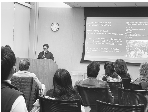
講座現場一隅（113年3月4日）