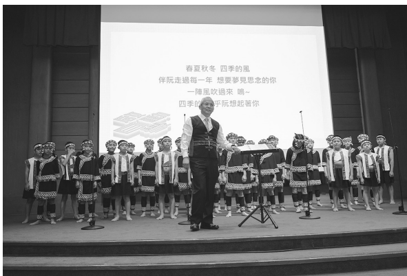
臺灣原聲童聲合唱團（113年3月9日）