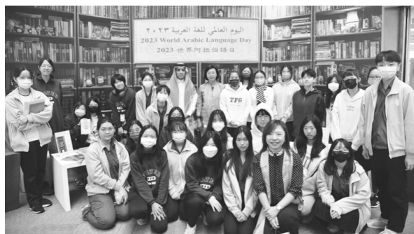
輔仁大學古中學程與北一女合辦課程之青年學子參觀展覽（112 年 12 月 18 日）