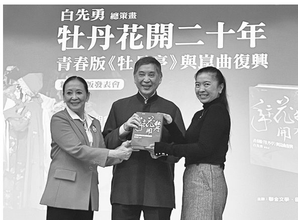
贈書儀式（113 年 3 月 27 日）