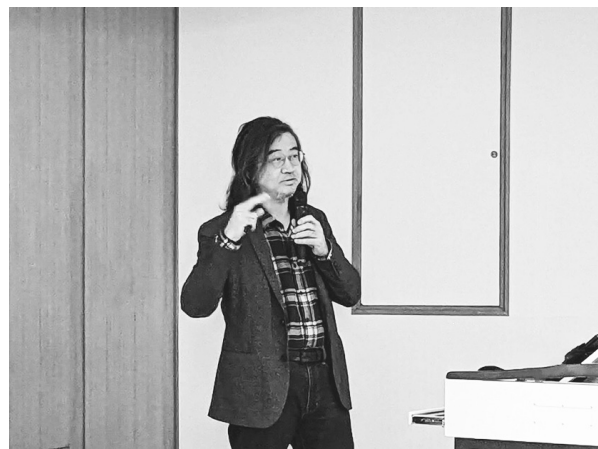
蔣竹山教授演講（112年12月24日）

即便講座是時正值聖誕佳節前夕，更遇寒流來襲，但仍有近30位聽眾出席，並於座談中與蔣竹山教授有相當熱烈的互動。會後亦抽出幸運聽眾，獲贈蔣竹山教授大作《島嶼浮世繪：日治臺灣的大眾生活》，不僅使聽眾更加瞭解本館數位典藏內容，更為本年度「凝影留聲—微光電影講座」畫下圓滿的句點。（知識服務組吳柏岳）