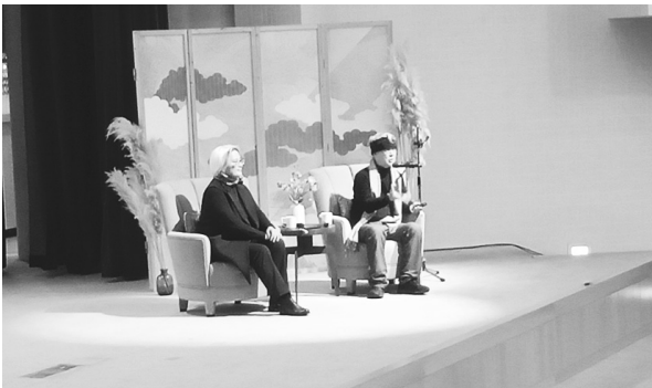
蔣勳老師（右）帶讀者進入原書的故事中（112年12月23日）