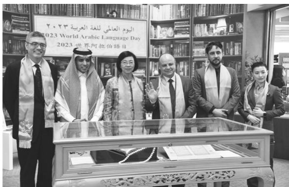
合辦雙方與嘉賓共同為展覽揭幕（112 年 12 月 18 日）

國圖前曾館長表示，阿拉伯語為世界重要語言，全球每天約有超過 4 億人口在使用。自 99 年經聯合國宣布每年 12 月 18 日為「世界阿拉伯語言日」（World Arabic Language Day）。沙烏地阿拉伯是臺灣在中東的最大貿易夥伴及最大原油供應國，雙方關係緊密。這是國圖首次與阿國共同舉辦活動，承蒙艾德爾代表多次蒞臨本館，以及政大阿語系師生就展覽內容與場地布置提出寶貴意見，促成本次展覽。值得一提的是本次展覽，雙方並邀得輔仁大學國際及兩岸教育處國際學生中心主任黃漢婷教授提供個人珍藏之 1504 年古蘭經手稿與 1702 年阿拉伯語古籍兩種，皆為難得一見。