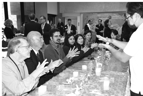
學人體驗民俗活動（113年2月23日）