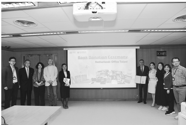
「2024 台北國際書展」荷蘭主題國館參展圖書捐贈儀式與會貴賓合影（113年2月23日）