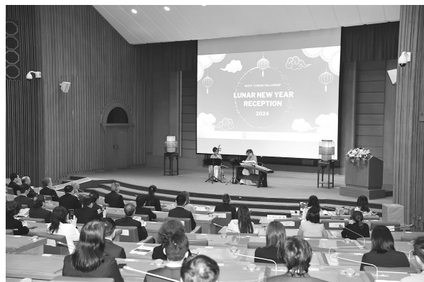
新春交流茶會開幕（113年2月23日）

本次活動特別準備了精美禮品，透過摸彩的方式贈送學人。會場並備有各式臺灣特色茶點，讓各位學人及與會貴賓於茶敘間彼此交流，同時國圖同仁首度以文化攤位形式，帶領學人體驗臺灣傳統技藝如捏麵人、彩繪燈籠、多色套印與傳統服飾等；活動安排豐富有趣，現場歡樂不斷，讓學人充份感受年節的歡愉氣氛。（漢學研究中心學術交流組唐惟真）