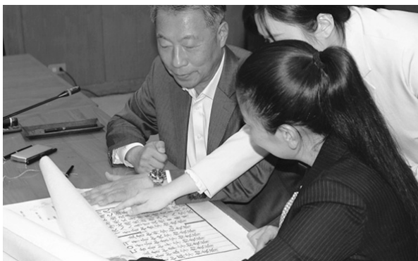
韓國國學振興院致贈雕版印刷（113 年 3 月 20 日）