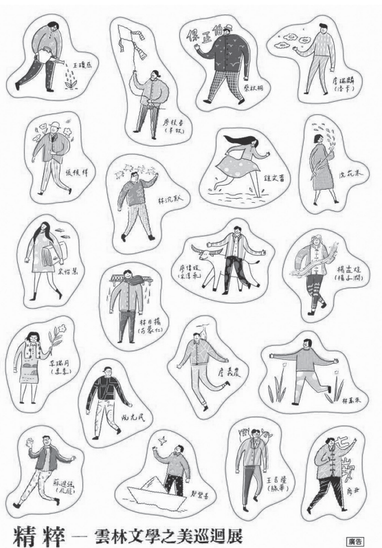
圖 17 貼紙設計物