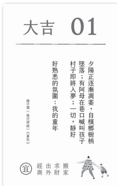
圖 11 籤詩設計