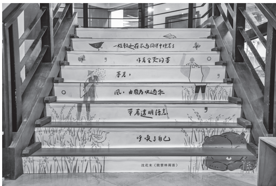
圖 7 主展區樓梯區展示作家沈花末的作品〈致雲林兩首〉