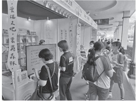
圖 24 高雄佛陀紀念館參展