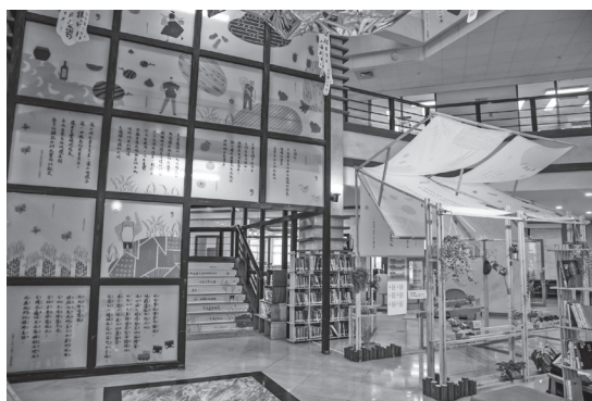
圖 5 主展區窗貼與展示架