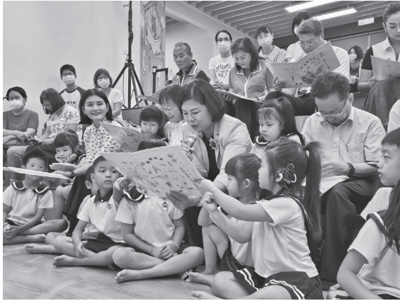
圖 18 縣長朗讀雲林文學作品