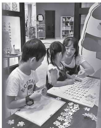
圖 13 手動互動體驗紀實區