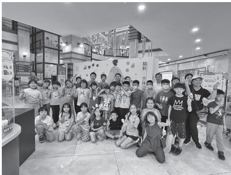
圖 20 學校參訪導覽

為強化觀展體驗與提升文化認知，展覽特設志工導覽服務，透過培訓志工導覽，藉由系統化的講解與專業引導，使參觀者得以更深入理解展覽內容，進一步拓展其對文學的認識與興趣。志工導覽不僅有助於參觀者建立更具結構性的知識框架，提升其對展品脈絡與意涵的理解，更透過情境式導覽與互動交流，強化展覽的沉浸感與參與度。此外，志工群體亦發揮文化推廣的關鍵角色，透過其專業講解與社群分享，促進展覽訊息的擴散與文化價值的延續，進而提升社會大眾對地方文學的關注與參與。（如圖 20）