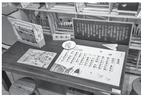
圖 12 手動互動體驗區

創作者如何透過日常生活的感知轉化為創作靈感，而在這一過程中，聲音的引導不僅加深了孩子們對文學的理解，更直觀地感受文學語言的韻律與美感，提升其對文學的興趣與學習動機。(如圖 14)