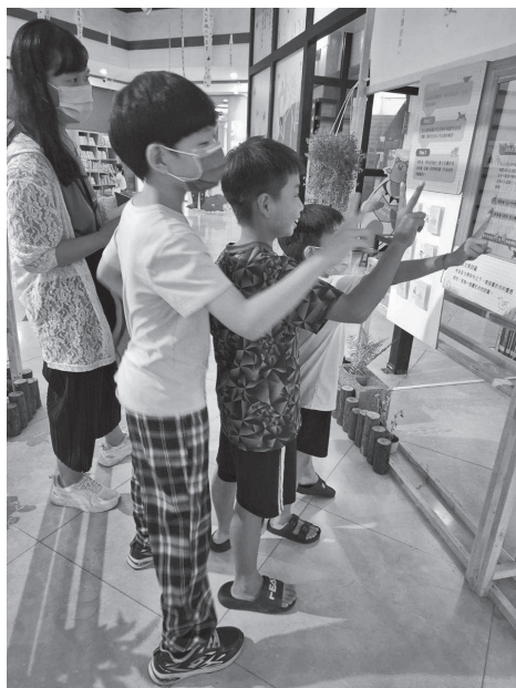
圖 10 魔鏡互動裝置民眾體驗紀實