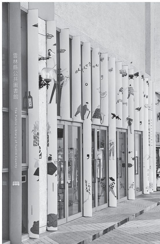
圖 3 入口區域