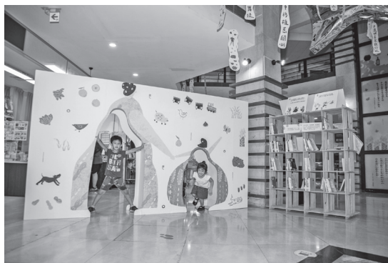
圖 4 展覽入口意象看板牆