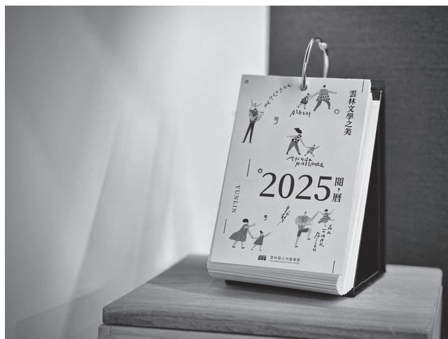
圖 2 2025 雲林文學桌曆《閱，曆》

延續本展覽「讓文學融入生活」的理念，推出 365 句雲林文學年曆，搭配館內借閱活動贈送。年曆精選雲林作家及雲林縣歷年出版的作家作品集、雲林文學獎作品中之經典語錄，並依循節慶與二十四節氣安排內容，使讀者得以透過每日一句的文學語錄，感受四季變遷與傳統節令的文化意涵，希冀將雲林文學之美深植讀者心中，為每一天的生活增添詩意與儀式感，進而強化在地文學與讀者之間的情感連結。