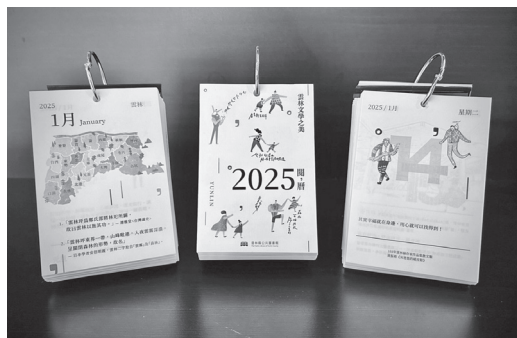
圖 15 文學桌曆設計物