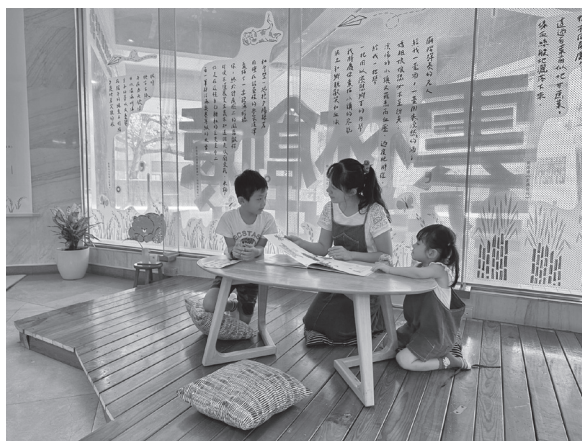
圖 9 席地閱讀區，玻璃窗上展示摘錄的雲林作家作品