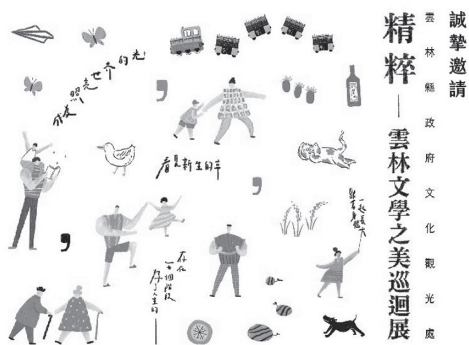
圖 16 邀請卡設計物