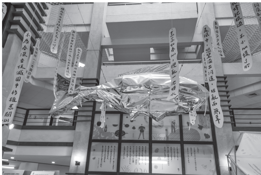
圖 6 主展區上方垂掛詩詞裝置