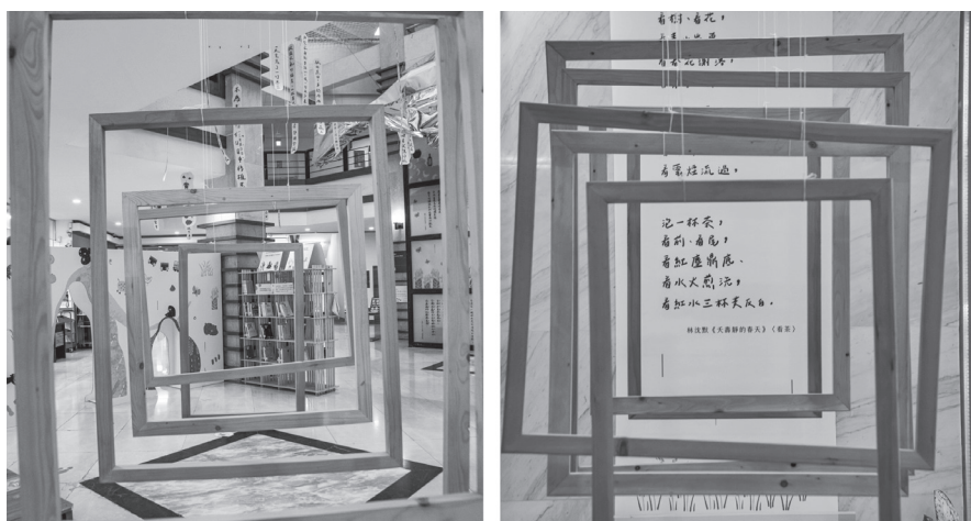
圖 8 「框中框」裝置