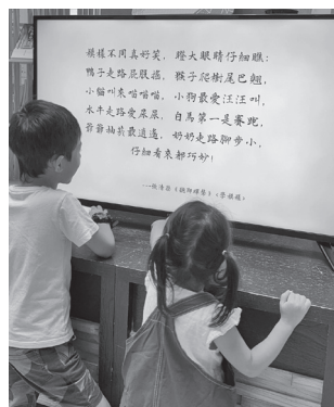
圖 14 視聽裝置