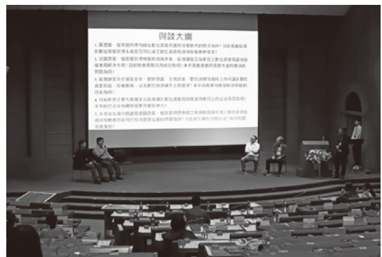
圖 104 中華圖書資訊學教育學會會員大會暨圖書館、檔案館及博物館區塊鏈數位資產智財保護與元宇宙創新應用研討會