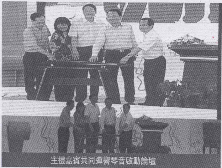
主禮嘉賓共同彈響琴音啟動論壇

目標為一年有變化，兩年見成，三年大變化，五年成規模。本壇得到專家、學者以及市民的參與，為橫琴新區的發展建言，出謀劃策。 道匡在論壇上發言指出，在橫發過程中，粵港澳如何合奏好橫琴協奏曲十分關鍵。為彈奏曲樂章，樂隊應由粵港澳三方組成，重點要落實橫琴開發的