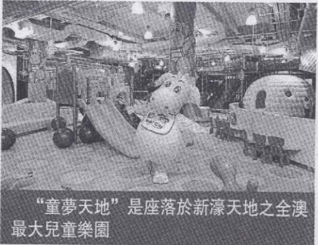
“童夢天地”是座落於新濠天地之全澳最大兒童樂園

派對日期及時間六月一日下午四時至晚上七時，地點新濠天地Hard Rock酒店二樓童夢天地。登記可電郵至kidscity@cod-macau.com或致電八六八·三〇〇〇，報名時應提供有關壽星仔女的資料、聯絡電話及電郵，活動明日將截止登記，名額有限，先到先得。小童進場時必須出示身份證件以確認出生日期，每位小童可跟一名成人出席。