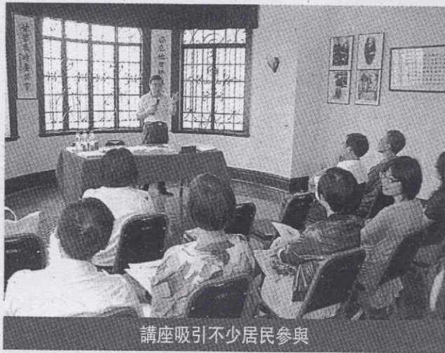
講座吸引不少居民參與