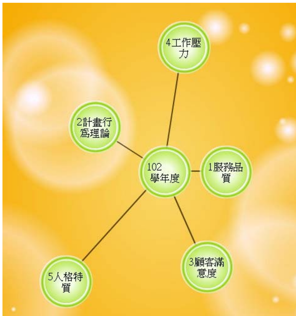
圖 3 102 學年度全國技專校院博碩士論文熱門研究主題知識地圖