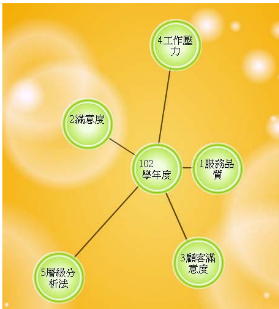
圖 1 102 學年度全國博碩士論文熱門研究主題知識地圖