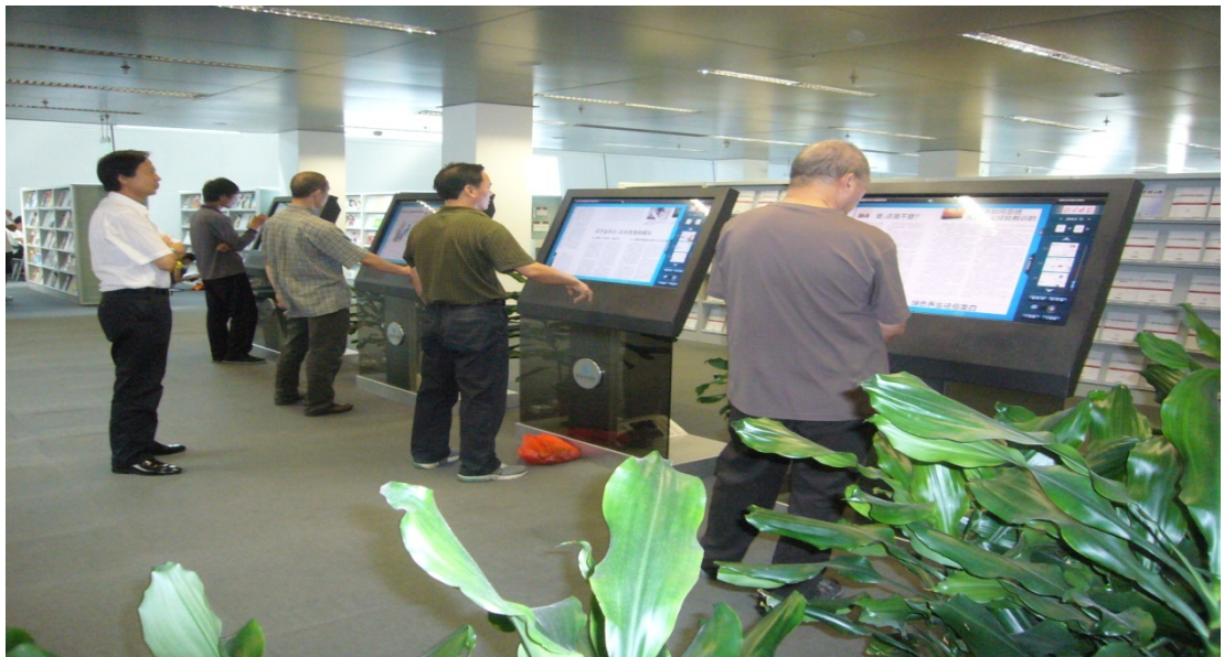
圖 16 北京國家圖書館數字閱讀區