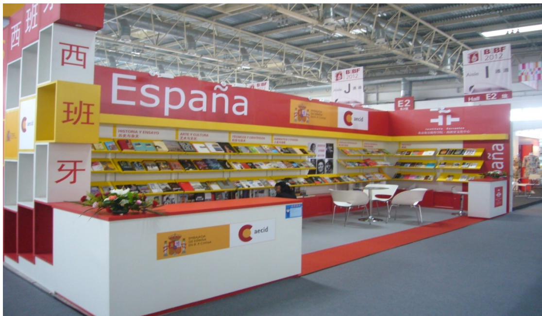
圖 3 圖書博覽會會場：西班牙圖書參展攤位