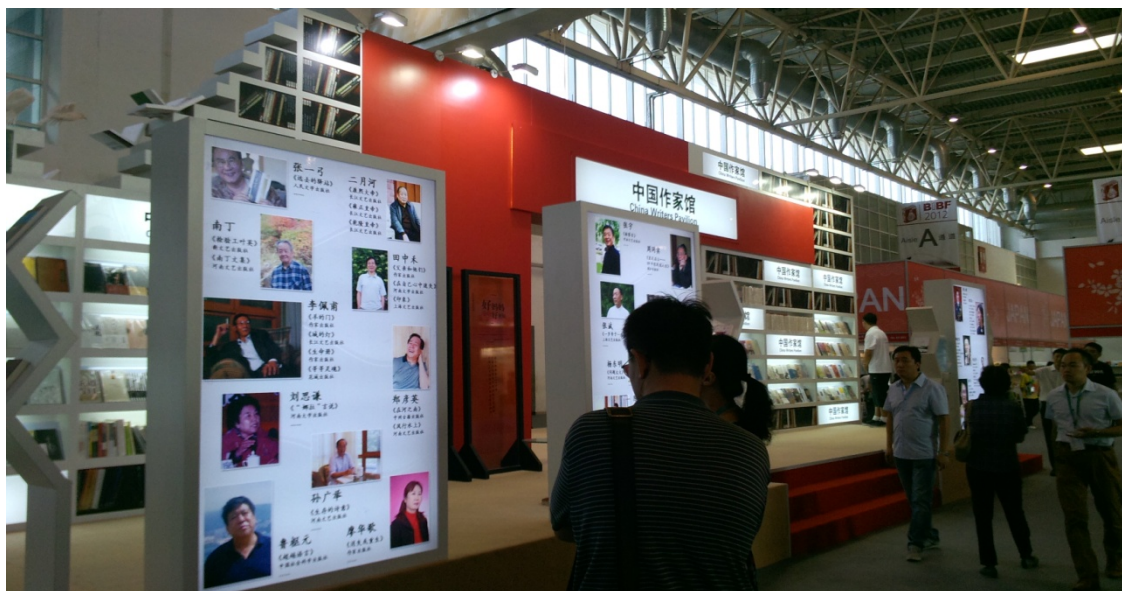
圖 4 圖書博覽會會場：中國大陸圖書參展攤位