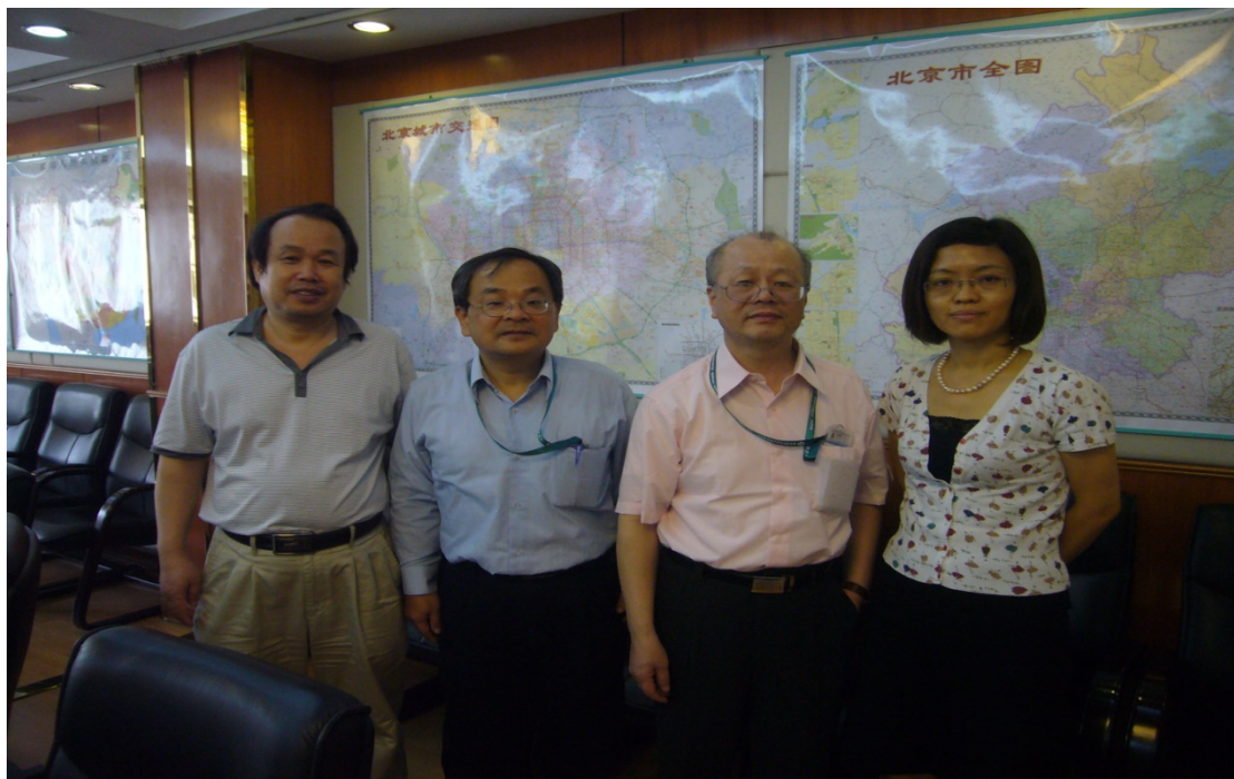
圖 6 圖書博覽會會場與臺灣參展人員合影