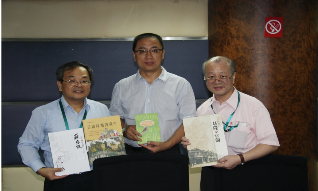
圖 9 參訪中國版本圖書館