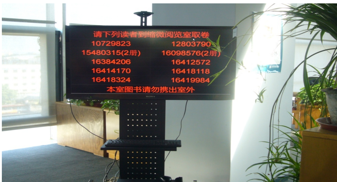
圖 14 北京國家圖書館調閱顯示機