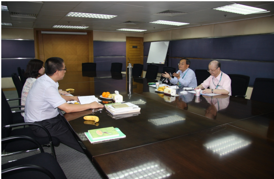
圖 10 有關 ISBN 編碼問題座談會