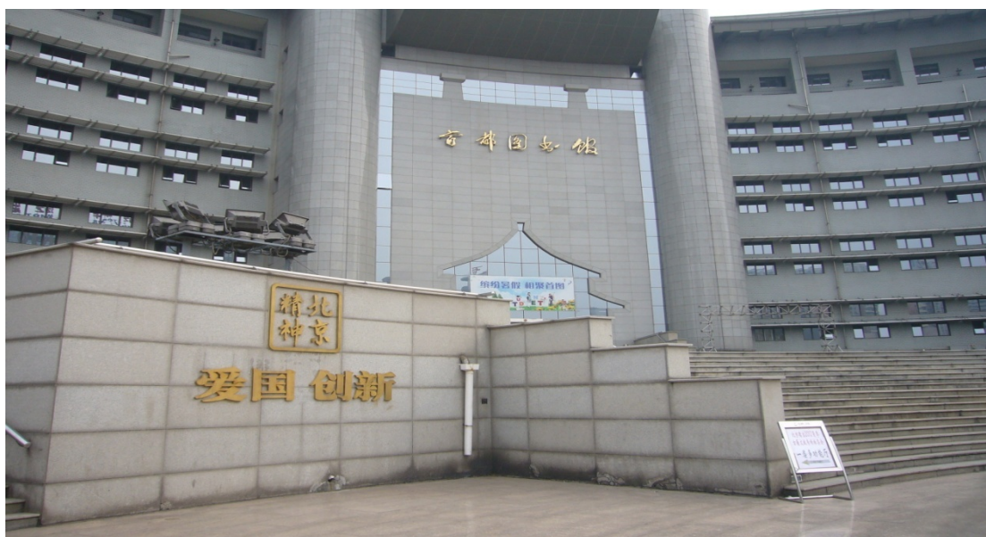
圖 17 北京首都圖書館 (1)