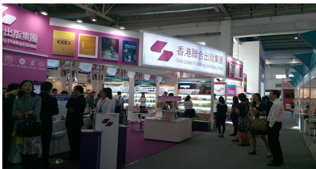
圖 2 圖書博覽會會場：香港圖書參展攤位