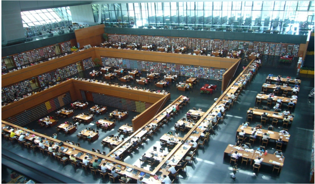
圖 11 北京國家圖書館閱覽情況