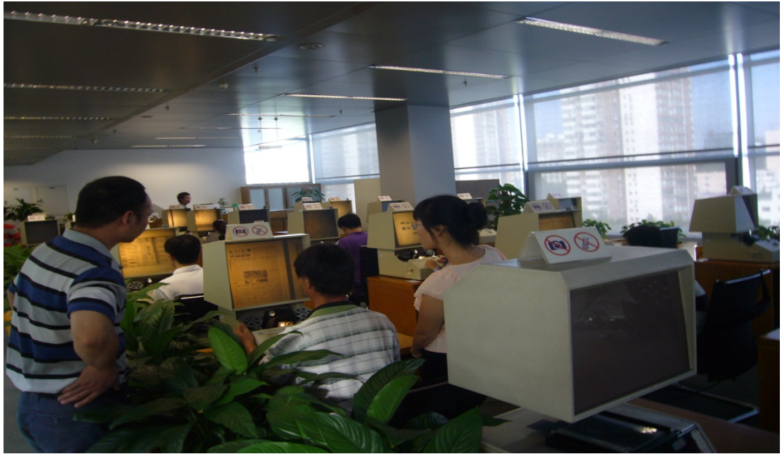
圖 15 北京國家圖書館縮微閱覽室