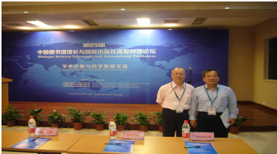
圖 7 圖書博覽會會場：參加出版論壇學術研討會