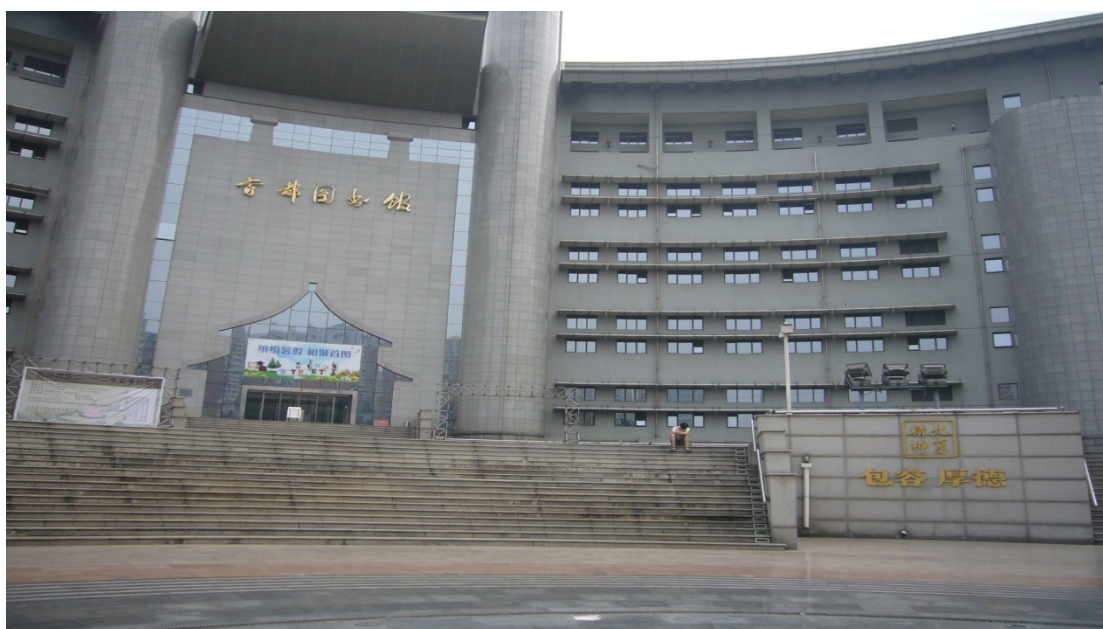
圖 18 北京首都圖書館 (2)