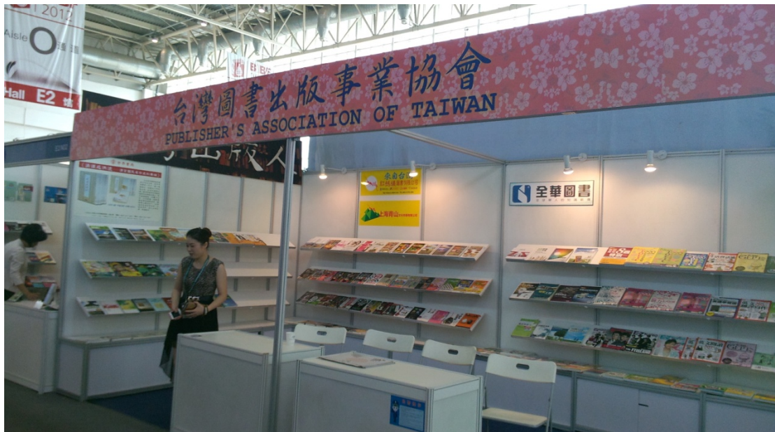
圖 5 圖書博覽會會場：臺灣圖書參展攤位