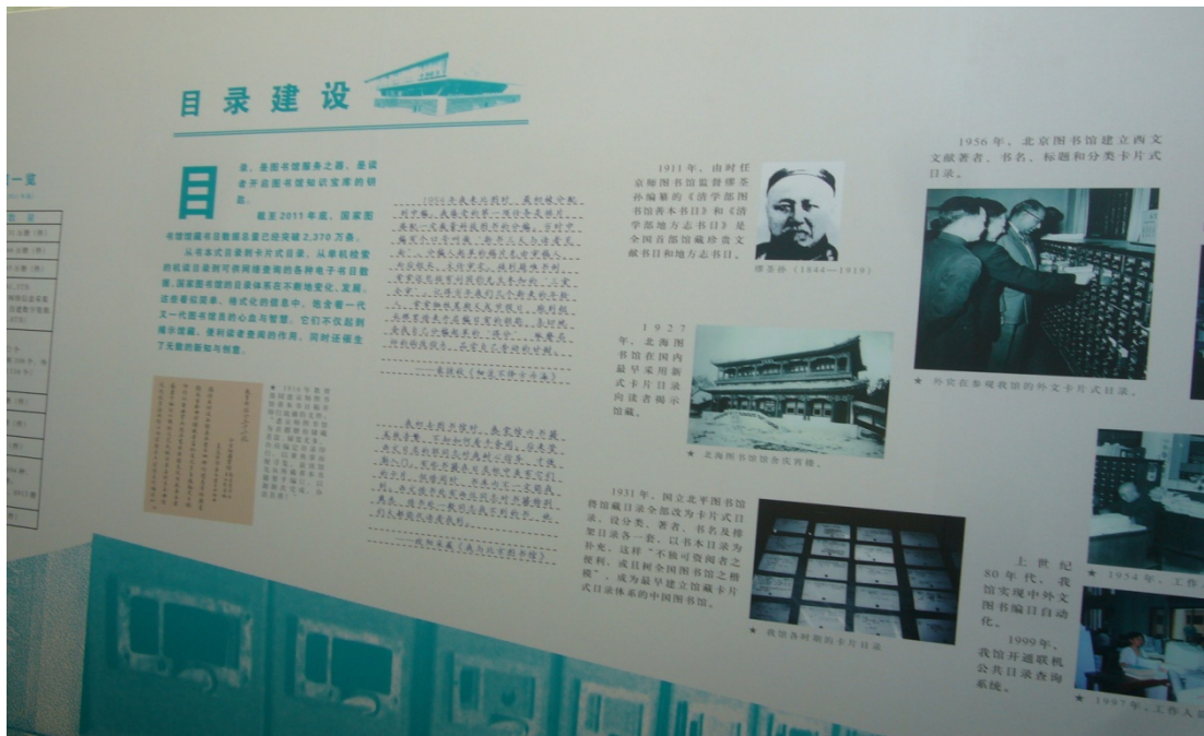
圖 12 北京國家圖書館百年展