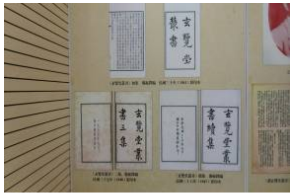
海峽兩岸玄覽堂珍籍合璧展展板