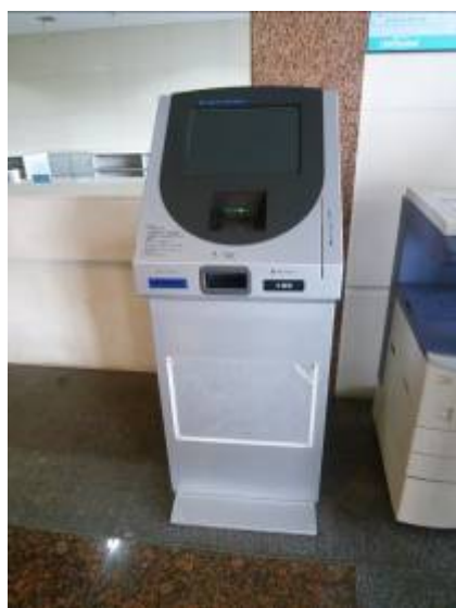
浙江大學圖書館紫金港校區基礎分館使用自助複印、打印、掃瞄一體機的付費刷卡（校園卡）機

同時，圖書館每年都積極參與學校的新生教育工作，開展多種形式的導讀活動，契合學校教育理念，現納入學校教育體系。該館還積極利用現代化服務措施，為全校師生提供查新和引證、原文傳遞等服務。除此以外，該館還逐步啟動多層次、個性化的學科服務，為學校的學科建設提供諮詢和支援。同時，圖書館還積極加強古籍的保護與揭示工作，持續推展充實特色資源。