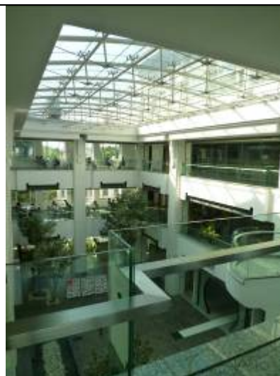
蘇州圖書館內部陳設情景

近年來致力於構建覆蓋全市的總分館體系，目前擁有一個總館及 36 個分館，2 輛流動圖書車以及 17 個流通服務點，總分館體系內部實行統一資源建設、統一服務標準、統一開展讀者活動。全館各館之間實行通借通還，提供免費辦