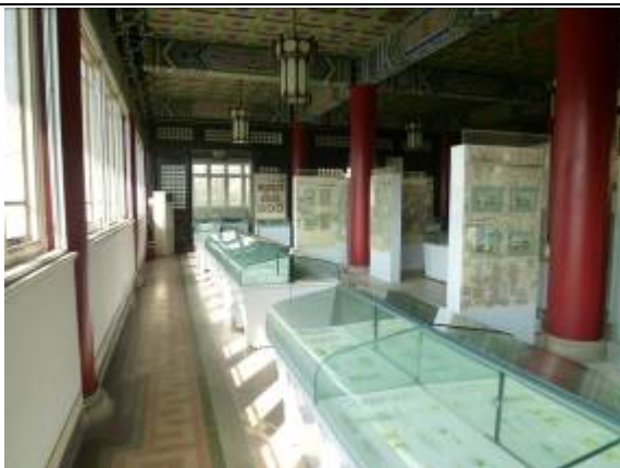
中國第二歷史檔案館展覽室（二）