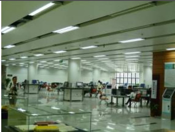
南京大學杜廈圖書館資訊檢索大廳