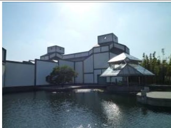
蘇州博物館傳統園林建築