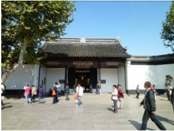
太平天國忠王府外觀