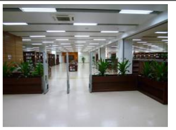
南京大學杜廈圖書館外文圖書閱覽室