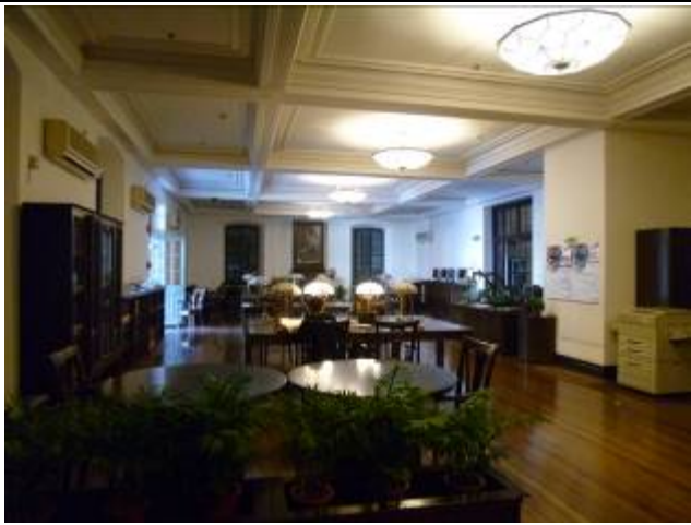
徐家匯藏書樓閱覽室

今日的徐家匯藏書樓不僅延續著閱覽服務、文獻典藏等功能，還拓展了文獻研發和會展旅遊等功能，以滿足社會對人類文化遺產——優秀歷史建築和舊版外文文獻的需求。