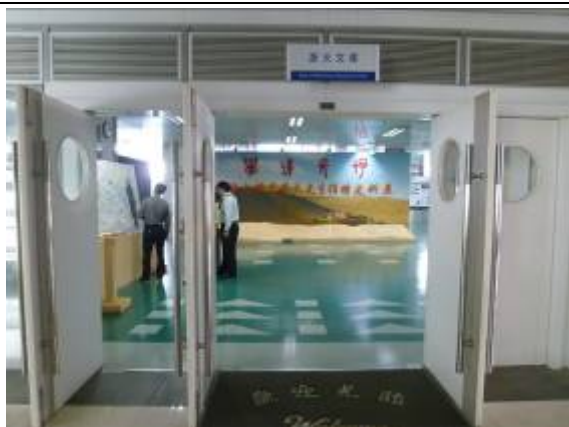
浙江大學圖書館紫金港校區基礎分館浙大文庫入口

該校聯合國內外的高等院校、科研機構共同承擔大學數字圖書館國際合作計畫（China Academic Digital Associative Library，簡稱 CADAL）。浙江大學圖書館還作為浙江省高校數字圖書館(ZADL)省中心及技術組、資源組、服務組牽頭館，擔任 ZADL 專案服務管理、主體建設等工作，為全省數位圖書館建設做出了表率 and 貢獻。同時，該館還參加了浙江省科技文獻共建共用平臺、浙江省聯合知識導航網等專案建設，透過網路向參與建設的高等院校、學術機構提供教學科研支撐。