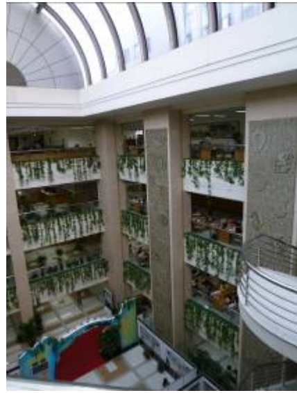
上海圖書館大廳的自然採光