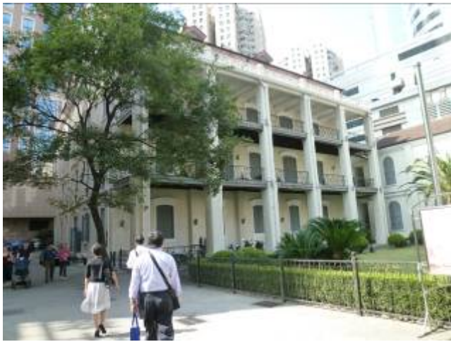
徐家匯藏書樓外觀