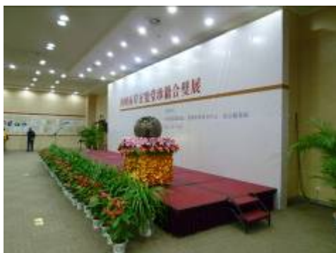
海峽兩岸玄覽堂珍籍合璧展

18日上午本館曾館長及同仁一行5人來到南京圖書館，參加「海峽兩岸玄覽堂珍籍合璧展」開幕式，此次聯展合作單位除我館外，尚有大陸北京國家圖書館及南京圖書館。