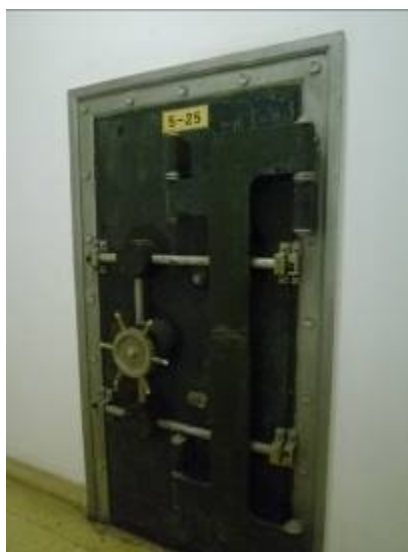
中國第二歷史檔案館鐵庫