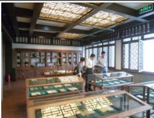
浙江大學玉泉校區圖書館特藏古籍部之「浙江大學藏書印章展」

該館館藏古籍總量達 16 萬餘冊（善本 1,700 餘種、2 萬餘冊）。所收古籍上起宋代，下迄民國時期，其中宋刻本 1 部，元刻本 5 部，明刻本 700 餘部。該館古籍中，以名家稿本、抄本及批校題跋本最具特色，稿本如清代孫詒讓稿本 20 種；批校題跋本如孫詒讓批校題跋本近 100 種，另有清人何焯、顧嗣立、何紹基、彭元瑞等，近人馬一浮、馬敘倫、薑亮夫等批校題跋本多種；抄本如明代淡生堂抄本、清代知不足齋抄本、清代內府抄本、清代玉海樓抄本等，都是不可多得之珍品。