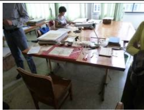
浙江大學玉泉校區圖書館特藏古籍部之「修裱室」