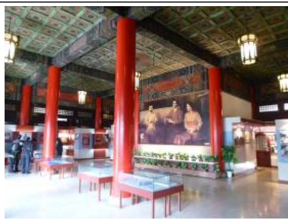
中國第二歷史檔案館展覽室（三）