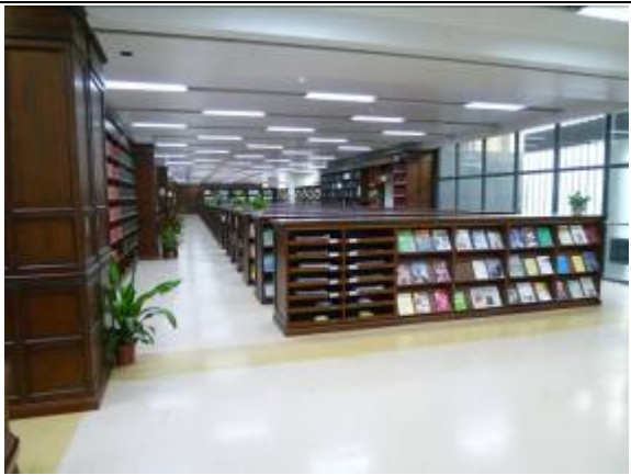
南京大學杜廈圖書館報刊閱覽室