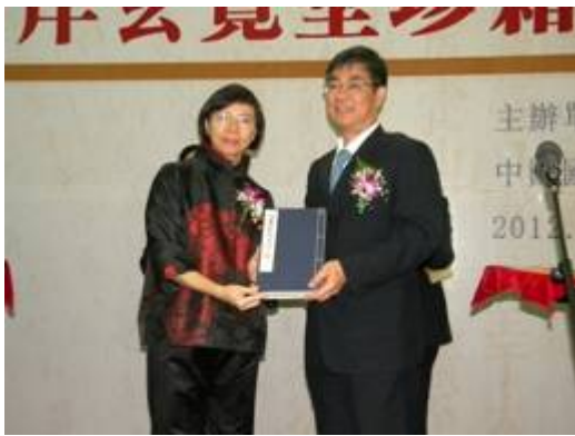
本館與大陸南京圖書館互贈古籍出版品

此次展覽本館提供《玄覽堂叢書》初輯 10 種、續輯 13 種，計 23 種復刻書，大陸北京國家圖書館則提供 12 種原典及鄭振鐸致張壽鏞書信 270 封《木音》，展現當時知識分子對於保護古籍之熱情；南京圖書館則展出 20 種原典，多為精品，如《蹴鞠譜》鈔本，記載漢魏以降毬戲之規範與動作，每則輔之以詩一首，便於記誦，頗為罕見。展場分為國立中央圖書館（本館更名前之機構名稱）籌備及發展、抗戰時期秘密搜購古籍始末，以及叢書及原典對照三大部分展出。