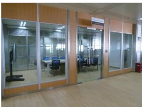
浙江大學圖書館紫金港校區基礎分館研究室