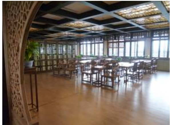
浙江大學玉泉校區圖書館特藏古籍部閱覽室

細說浙江大學圖書館是大陸歷史最悠久的大學圖書館之一，其前身是始建於1897年的求是書院藏書樓。該圖書館由玉泉校區圖書館、紫金港校區基礎分館、紫金港校區農醫分館、西溪校區圖書館、華家池校區圖書館等五大館舍組成，總建築面積約8.6萬平方米。圖書館設有6個業務部門，分別為研究發展部、讀者服務部、參考諮詢部、資源建設部、數位圖書館研究與技術中心、古籍特藏部（玉泉校區）。