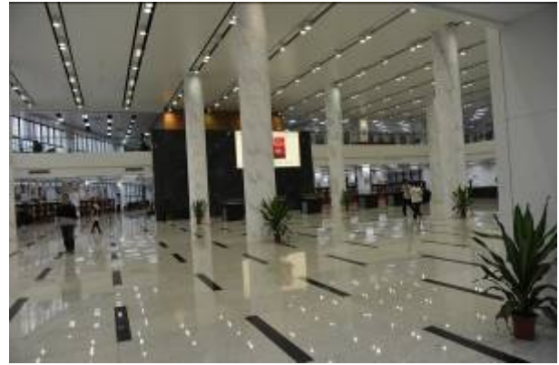
南京大學杜廈圖書館大廳

杜廈圖書館外部造型獨特，風格莊重典雅。俯視該館，三個體塊圍繞內院組成一個巨大的「電腦硬碟」，各體塊間通過寬闊的橋廊相連，既相對獨立又相互聯繫；從校區正門看該館，各體塊錯落掩映，猶如一部開啟的書，寓意「書山有路勤為徑，學海無涯苦作舟」。因此，該館既表現了文獻資訊中心的功能性特徵，更體現了圖書館現代建築意象。