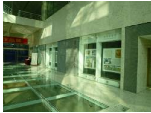
南京圖書館六朝遺跡展示區

在館舍配置部分，地下一層設有展覽廳、學術報告廳、多功能廳及六朝遺跡展示區。一層設有導讀台、存包處、綜合服務區、中文報紙閱覽室、少兒書刊借閱室、視障人書刊借閱室、江蘇作家作品館。二層為書刊借閱服務區，設有中文圖書借閱、外文圖書借閱區域。三層以書刊閱覽服務為主，設有中文圖書閱覽、中外文期刊閱覽、中文過刊借閱、中外文工具書查閱和文獻檢索區域。四層為專題文獻服務區，設有港澳臺文獻、藝術圖像資料、民國文獻、地方文獻等十多個專題閱覽區。五層設有電子閱覽室、多媒體欣賞室、古籍閱覽室。六、七層為典藏文獻服務區，提供典藏中外文過刊、外文圖書、1949年以後中文圖書的查閱及複印服務。