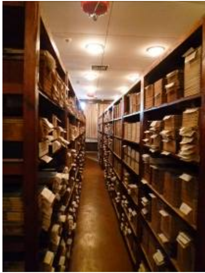
浙江大學玉泉校區圖書館特藏古籍部善本書庫(一)