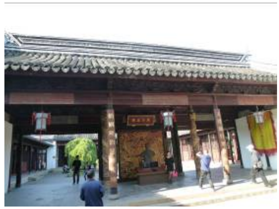
太平天國忠王府內景

作為一座集傳統與現代、傳承與創新為一身的現代化園林式博物館，如今的蘇博新館已成為蘇州地區一處全面收藏、展示、宣傳中國古代藝術和世界現代藝術的中心。參觀蘇州博物館後，我們一行三人搭乘高鐵前往南京，夜宿南京。