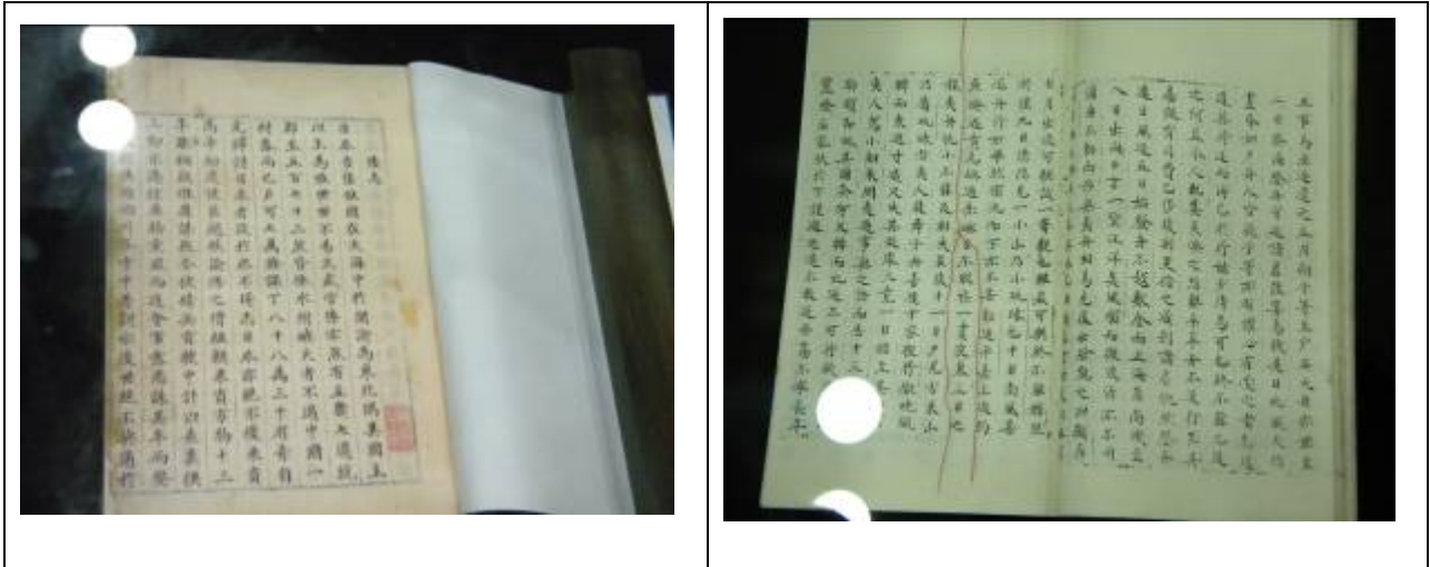
本館參展之《倭志》，屬《玄覽堂叢書》續集，原典為明鈔本，此書中錄有明陳侃《使琉球錄》內容，左圖為本館該書卷端書影，及右圖南京館影印本內文，重點處有紅毛線標示。

本館提供的《倭志》一書因所錄《使琉球錄》中提及明朝官員對於釣魚台及周邊相關島嶼的具體描述，而成為媒體注意的焦點，現場也吸引許多民眾參觀，此次活動可說是相當成功的兩岸文化交流。