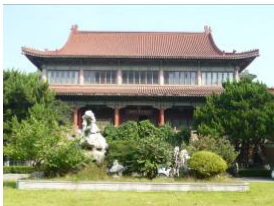
中國第二歷史檔案館外觀

中國第二歷史檔案館是集中保管中華民國時期（1912-1949）各個中央政權機關及其直屬機構檔案的國家級檔案館，成立於 1951 年 2 月，原名南京史料整理處，隸屬中國科學院近代史研究所，1964 年改隸國家檔案局，並易現名。