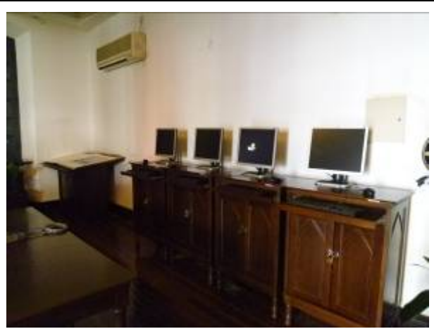
徐家匯藏書樓資料查詢區

徐家匯藏書樓集讀者服務、文獻保管、開發研究功能於一體。一樓為會展展廳設有特色文獻陳列展，並不定期舉行各種中小型會議展覽活動。二樓為讀者閱覽區，並提供 iPac 查詢、資料複印、參考諮詢等各項服務。徐家匯藏書樓展覽服務，展廳不定期舉行各種中小型會議和展覽活動。展廳面積 200 平米。另有特色文獻陳列展。