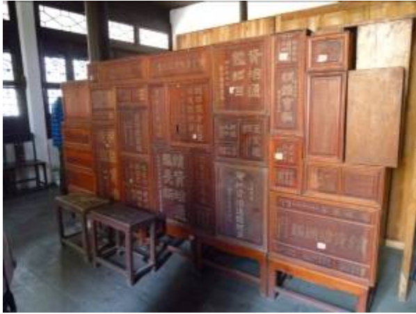
嘉業藏書樓的古籍木箱

藏的兩大特點：一是不專重于宋元刊本，更著眼於明清兩代。二是不惜重金廣收地方誌。其中可稱「海內秘藏」的珍本，就有 62 種。