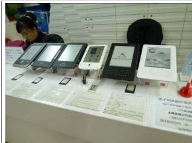
上海圖書館電子閱覽器外借服務

上海圖書館電子資源遠端服務以及「我的圖書館」(一卡通行證)讀者免費閱讀等現代化數位服務新措施。