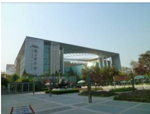
南京圖書館外觀遠景

南京圖書館新館坐落於市中心大行宮地區，於 1998 年計畫，2002 年動工，2006 年落成並部分對外開放，2007 年實現全面開放。新館占地面積 2.52 萬平方米，建築面積 7.87 萬平方米，建築投資 4 億元人民幣。館內設有讀者座位 3,000 個，資訊點 4,000 多個。在功能佈局上，新館主要體現以「用」為主、以讀者為中心的理念，以開架為主要服務方式，實現藏、借、閱、諮詢、管理的一體化。