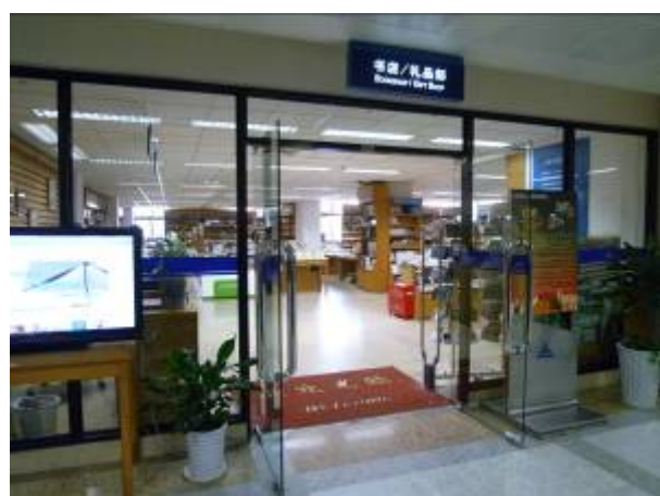
上海圖書館附設書店及禮品部