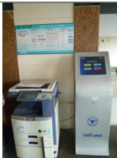
浙江大學圖書館紫金港校區基礎分館校園自助複印、打印、掃瞄一體機