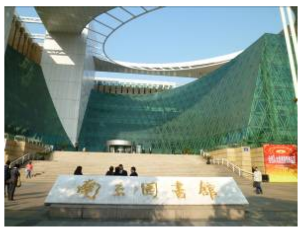
南京圖書館外觀近景