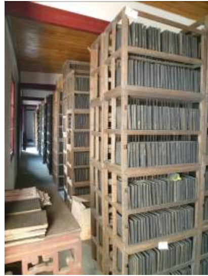
嘉業堂雕版收藏，所有版片以直立方式，置於木架