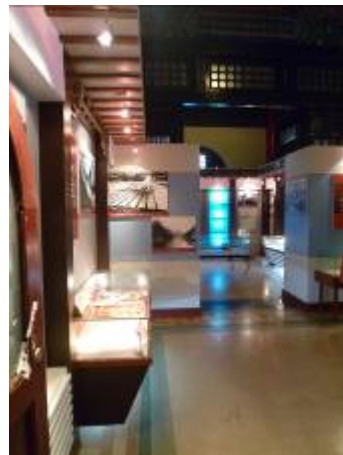
中國第二歷史檔案館展覽室（一）