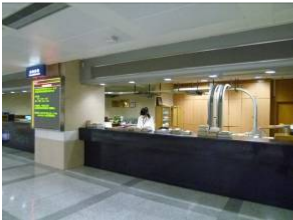
上海圖書館總服務臺