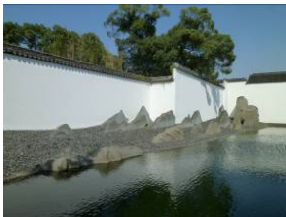
蘇州博物館中國園林山水美景

博物館的設計結合了道統的蘇州建築風格，將博物館置於院落之間，使建築物與其周遭環境相協調。博物館的主庭院等於是北面拙政園建築風格的延伸和現代版的詮釋。新的博物館庭院，較小的展區，以及行政管理區的庭院在造景設計上擺脫了道統的風景園林設計思路。而新的設計思路是為每個花園尋求新的導向和主題，把道統園林風景設計的精髓不斷挖掘抽提並形成未來中國園林