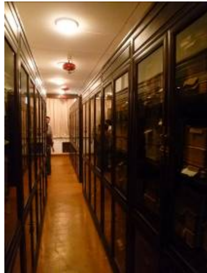
浙江大學玉泉校區圖書館特藏古籍部善本書庫(二)

該館館藏古籍總量達 16 萬餘冊（善本 1,700 餘種、2 萬餘冊）。所收古籍上起宋代，下迄民國時期，其中宋刻本 1 部，元刻本 5 部，明刻本 700 餘部。該館古籍中，以名家稿本、抄本及批校題跋本最具特色，稿本如清代孫詒讓稿本 20 種；批校題跋本如孫詒讓批校題跋本近 100 種，另有清人何焯、顧嗣立、何紹基、彭元瑞等，近人馬一浮、馬敘倫、薑亮夫等批校題跋本多種；抄本如明代淡生堂抄本、清代知不足齋抄本、清代內府抄本、清代玉海樓抄本等，都是不可多得之珍品。