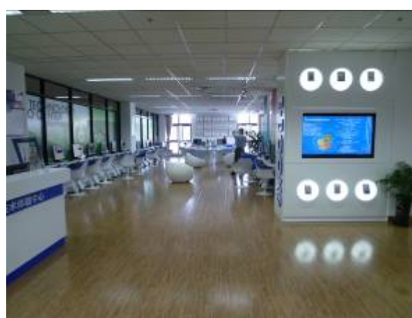
上海圖書館新技術體驗中心

館內擁有設施完善的閱覽室、個人研究室、展覽廳、學術活動室以及報告廳、多功能廳和音樂欣賞室等。採用現代化文獻採訪、編目、流通、書目查詢等功能的電腦集成管理和服務系統。引入先進的技術和設備，助推讀者的閱讀，相繼推出外借數位移動閱讀器、手機圖書館、電子閱報欄、網上委託借書、e 卡通—