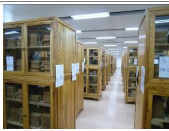
南京大學杜廈圖書館古籍書庫

該館每層約 10,000 平方米，分為 3 個服務區，以閱覽空間和書庫為主，同時配套設置目錄廳、出納廳等設備和辦公輔助空間，整體佈局緊湊合理。全樓