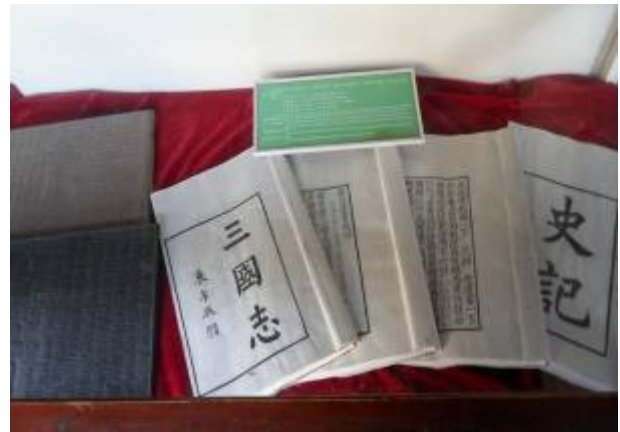
嘉業堂藏書以宋刊《史記》、《漢書》、《後漢書》、《三國志》最為珍貴，號稱鎮庫之寶，特設「宋四史齋」專藏。