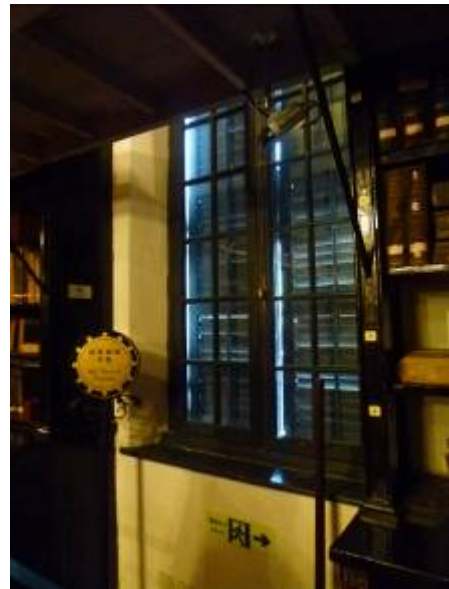
徐家匯藏書樓窗戶也有雙重保護

徐家匯藏書樓於 1956 年正式併入上海圖書館，之後亞洲文會圖書館、海光圖書館、原上海租界工部局圖書館藏書也相繼移入徐家匯藏書樓。今天的上海圖書館收藏舊版外文文獻計 56 萬冊。