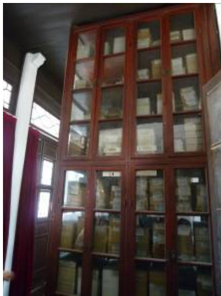
嘉業藏書樓收藏古籍木櫃