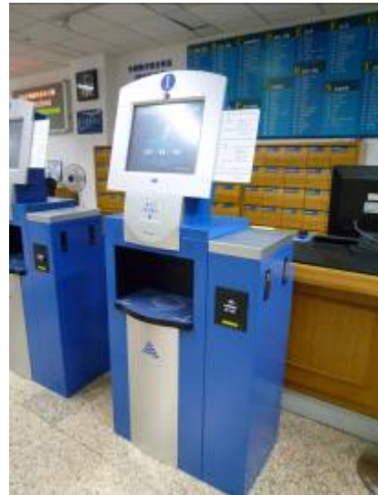
上海圖書館借還書設備

該館館藏豐富，門類齊全。擁有圖書、報刊和科技資料近 5,200 萬冊（件）及 15 萬餘張老唱片等非書資料。館所為上海市古籍保護中心所在地，館藏歷史文獻 370 萬冊，距今 1,400 年的《維摩詰經》是該館最早的藏品。另擁有家譜 342 姓氏計 1.8 萬餘種，是國內外收藏中國家譜最多的圖書館。