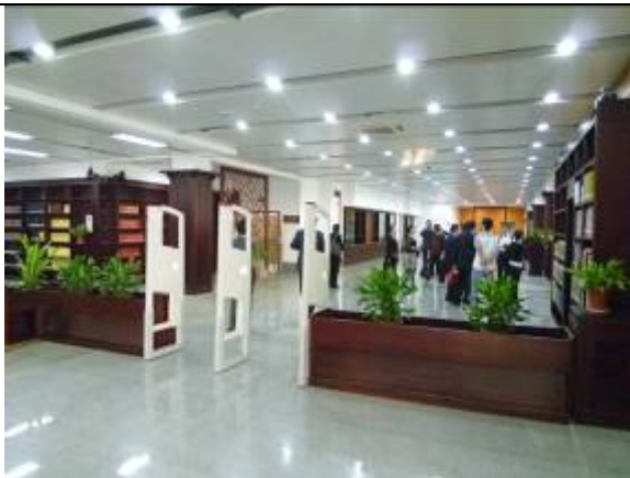
南京大學杜廈圖書館古籍閱覽室