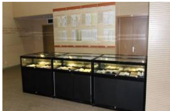
海峽兩岸玄覽堂珍籍合璧展展場