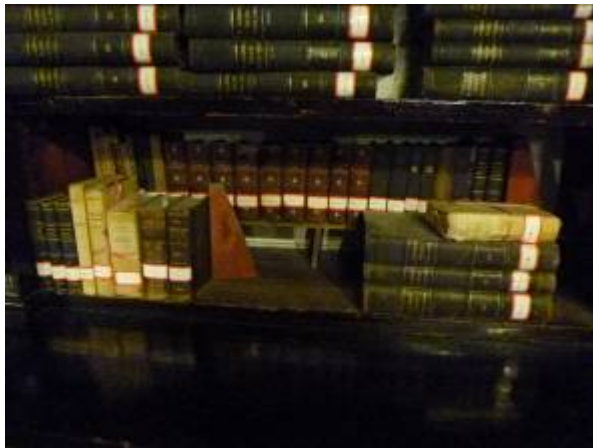
徐家匯藏書樓圖書與地面必須相隔距離，以維安全