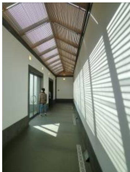
蘇州博物館幾何屋頂