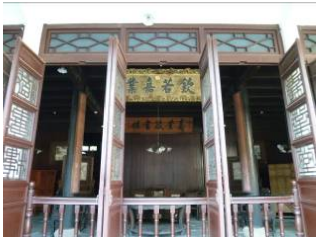
清朝溥儀皇帝題贈「欽若嘉業」九龍金匾額