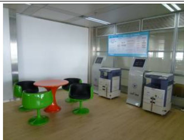
浙江大學圖書館紫金港校區基礎分館討論室