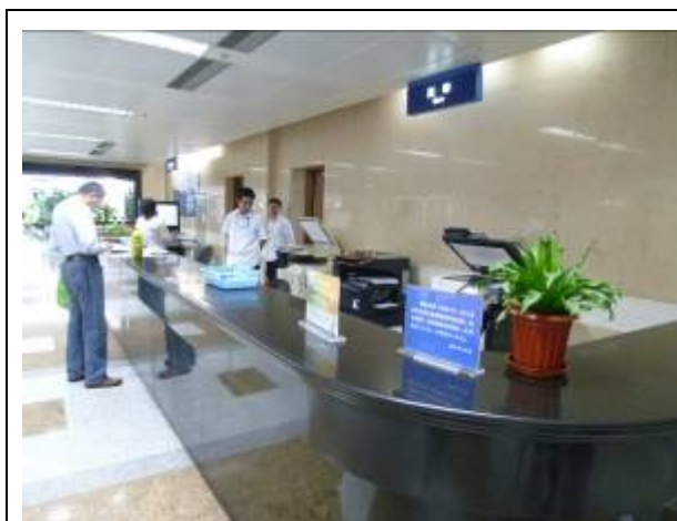
上海圖書館複印櫃台

社團單位調撥及政府收購。歷經半個世紀的經營，如今該館藏有已編古籍 130 餘萬冊（其中善本約 18 萬冊）、碑帖 16 萬件（其中善本 2 千餘件）、明清近代尺牘 11 萬 8 千種。這顯示該館對搜集保藏傳統文化遺產的高度重視。