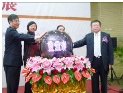
本館曾淑賢館長、大陸南京圖書館徐小躍館長與大陸國家圖書館張志清副館長共同揭幕