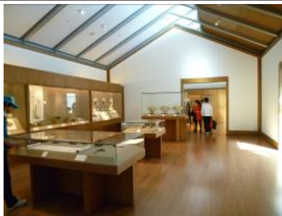
蘇州博物館展覽區