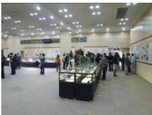
海峽兩岸玄覽堂珍籍合璧展展場