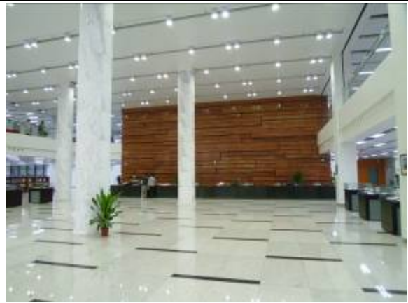
南京大學杜廈圖書館總服務台