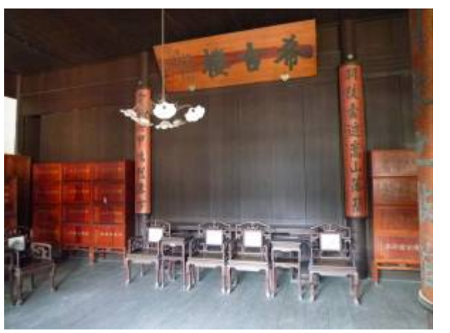
嘉業藏書樓內部陳設情形