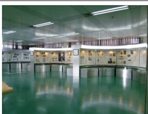
浙江大學圖書館紫金港校區基礎分館浙大文庫內景

目前，該館在文獻資源、學科服務等方面的建設已進入了跨越式發展階段，基本建立了基於網路環境的新型服務體系。另外，我們也同時參觀了收藏浙大教師與校友的著作約 1 萬餘種的「浙大文庫」，以及各樓層閱覽室及資訊服務的狀況，爾後結束浙江大學圖書館的參訪，繼續前往南潯嘉業藏書樓。