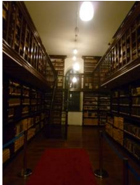
徐家匯藏書樓書庫一角