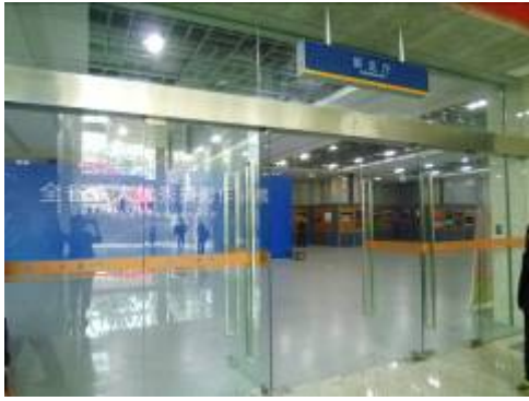
南京圖書館展覽廳