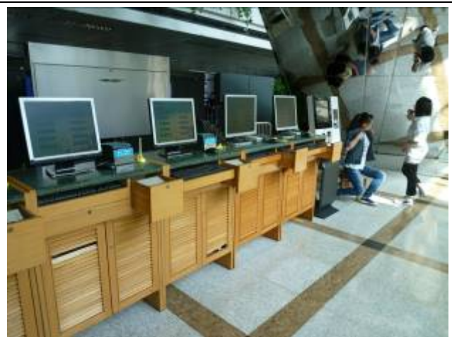
上海圖書館綜合查詢區