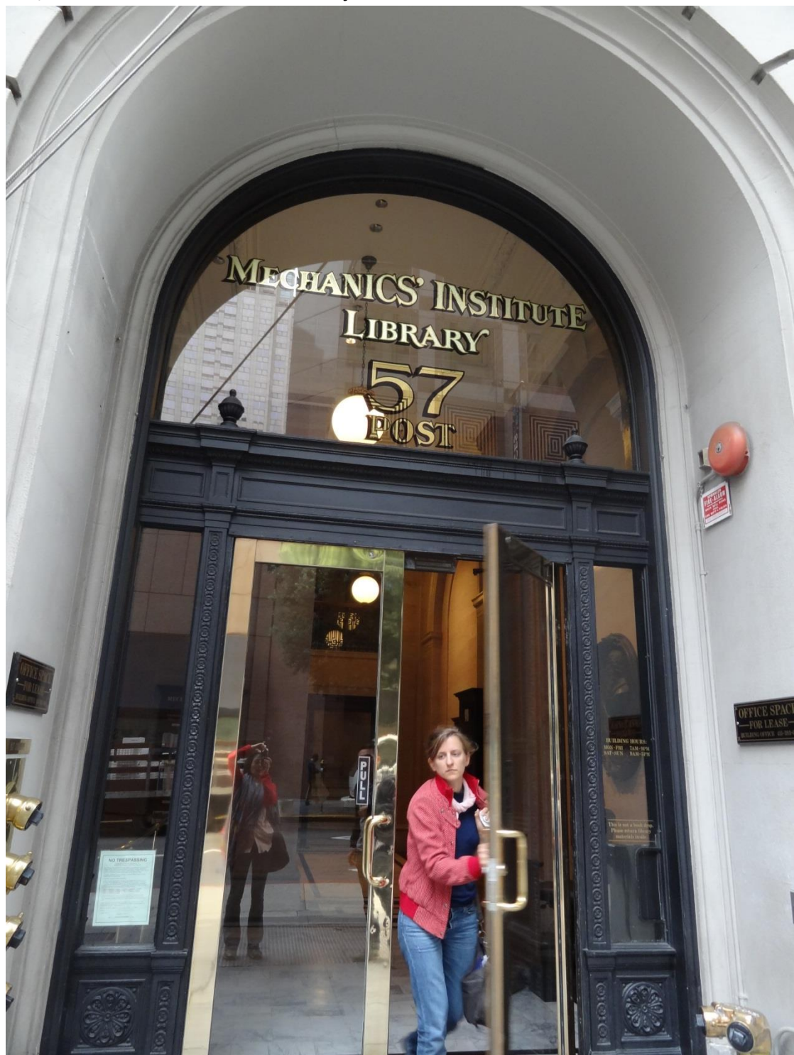
The Mechanics' Institute Library圖書館成立於西元 1854年