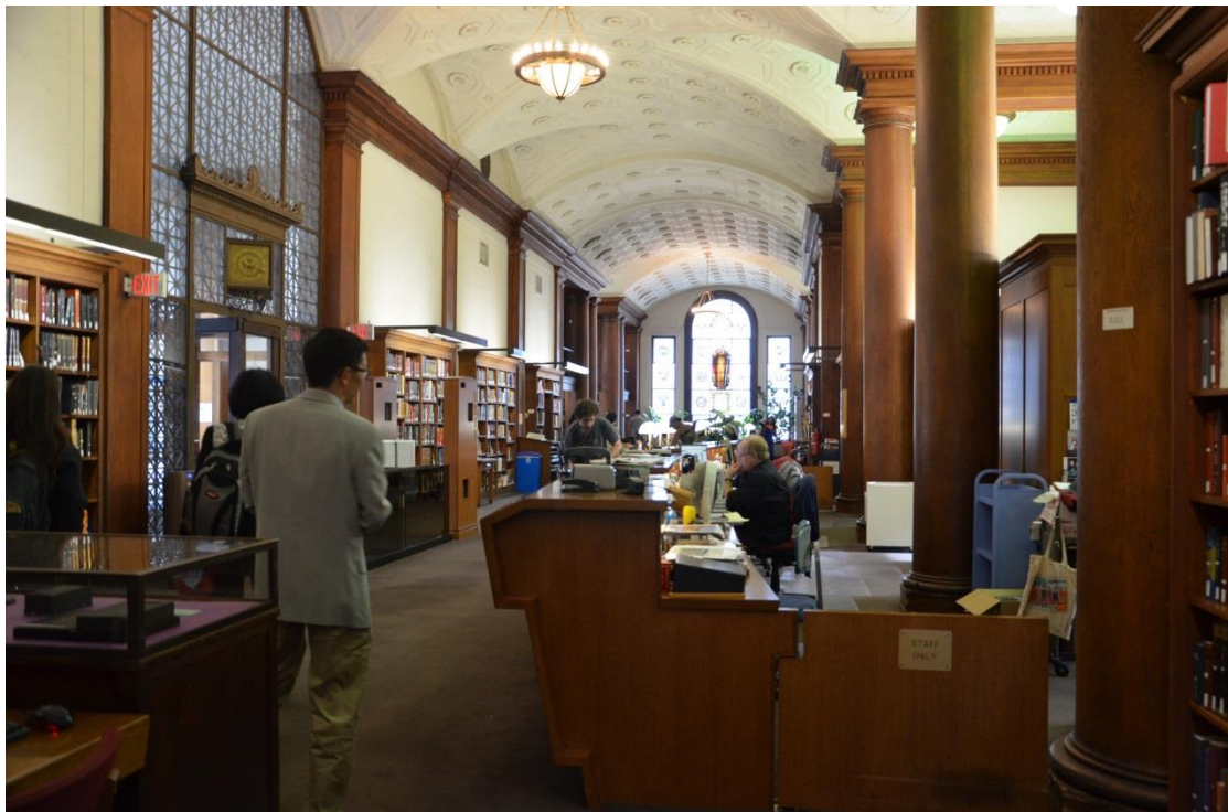
哥倫比亞大學東亞圖書館參考室一景