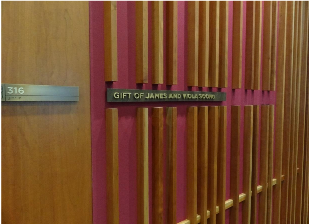
東亞圖書館中以捐款者之姓名做為研究室的題名