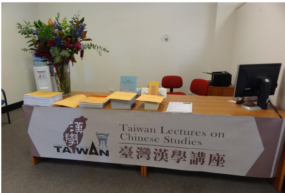
加州大學柏克萊分校中國研究中心「臺灣漢學講座」會場一隅