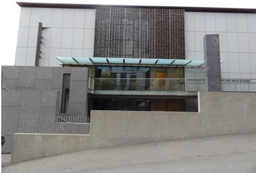
C. V. Starr East Asian Library為紀念已故田長霖校長而籌資興建