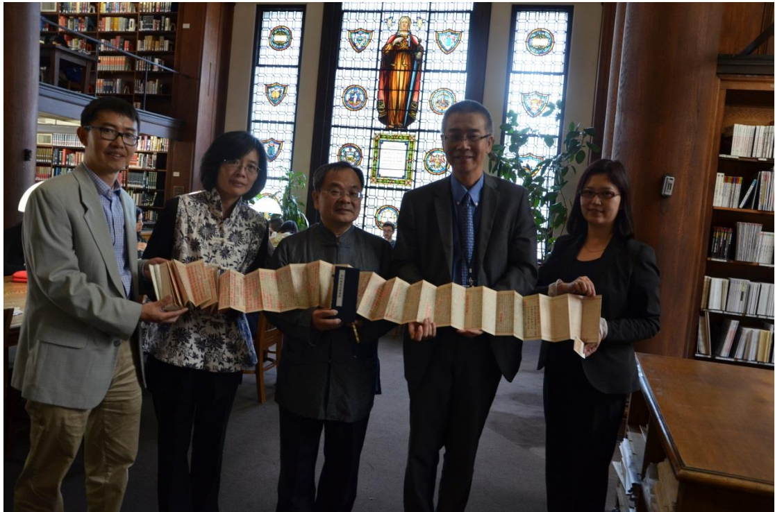
致贈本館國寶級古籍元至正元年(1341年)朱墨雙色印本《金剛般若波羅蜜經復刻本與哥倫比亞大學東亞圖書館珍藏