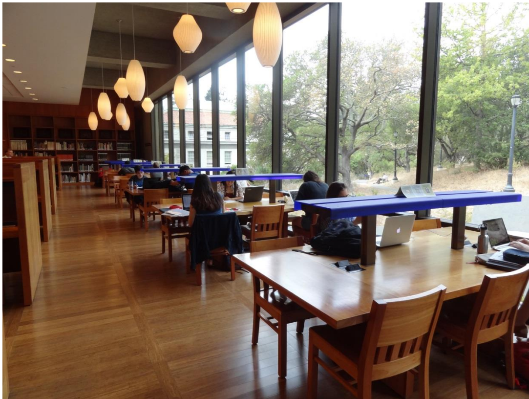
東亞圖書館中閱覽室一景