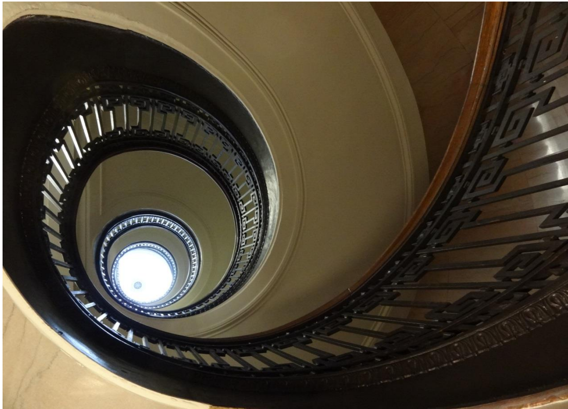
圖書館超過百年歷史的原木手扶梯，古樸高雅