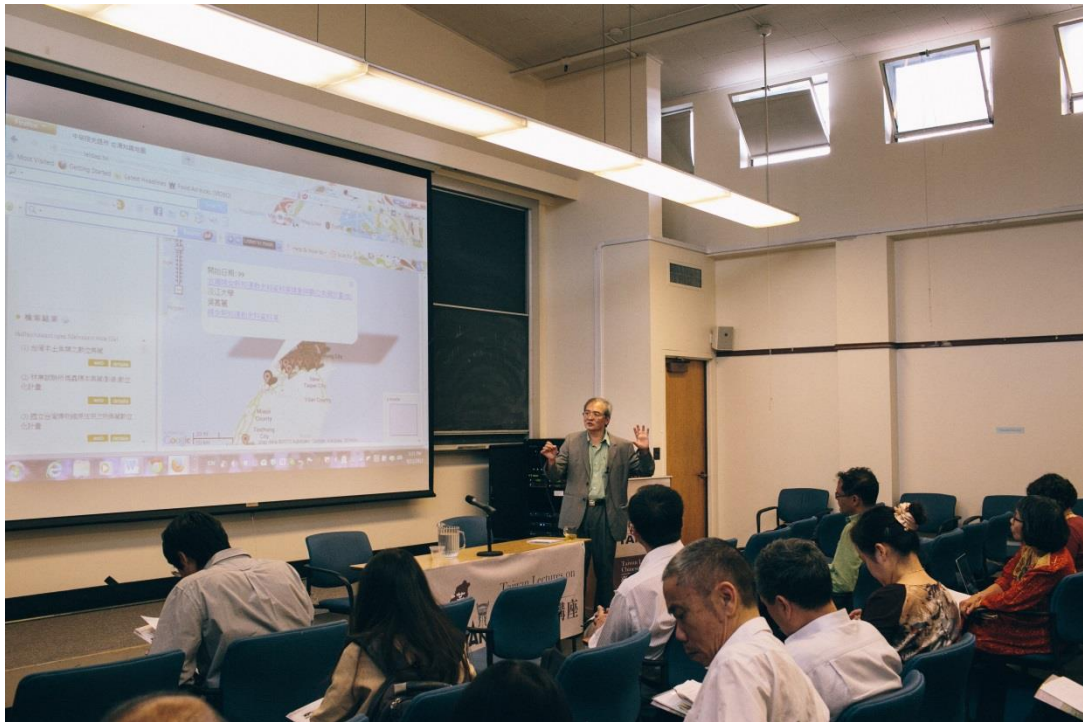
廖炳惠教授主講「Taiwan Studies Digital Archives臺灣研究數位資料庫」