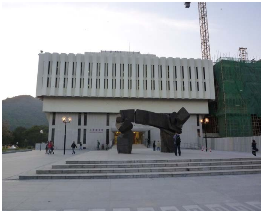
香港中文大學圖書館（總館）