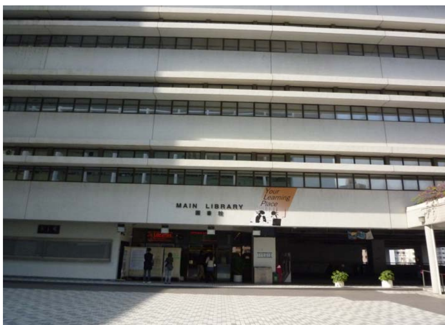
香港大學圖書館（總館）