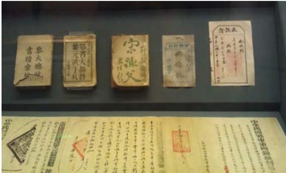
辛亥革命博物館展示辛亥革命相關的重要文件和出版品