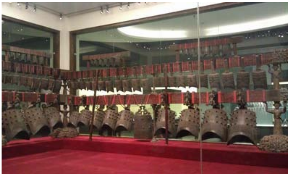
湖北省博物館展示鎮館之寶「曾侯乙編鐘」