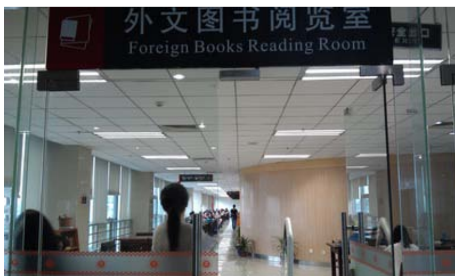
華中師範大學圖書館造型優雅的洗手間（中間半圓型的地方）

該館的管理模式是希望成為一個文獻資源中心和自主學習中心，具有智能化、數位化及個性化的新型圖書館，如該館閱覽大廳以桂花的花型設計閱覽座椅以及將桂花顏色融入圖書館網站設計中，在在呼應位在桂子山上的大學校園植有 1 萬多棵桂花樹的優雅氛圍。為加速歸還圖書分類整理及上架，設有智慧還書系統。空間設計也頗具助記功能及巧思，每一樓層的指標非常明確；每一樓層的洗手間都採用不同花色的牆面，造型也很特殊，不會令人想到是衛生設施。為便利學生雨天有傘可用，該館館長發明一個自助借還雨傘的系統，若未歸還，就會影響借書的權益，據說幾乎是 99% 的歸還率。