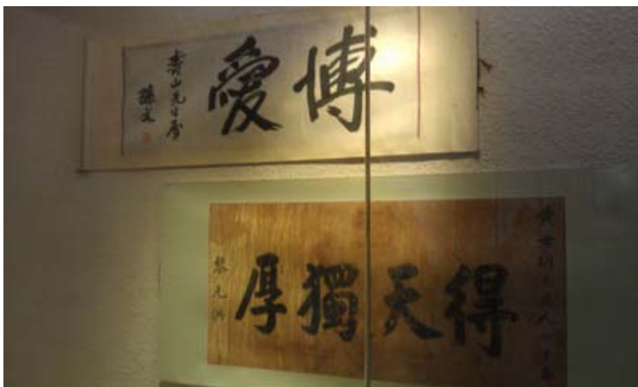
辛亥革命武昌起義紀念館陳列國父孫中山先生和黎元洪先生的墨寶