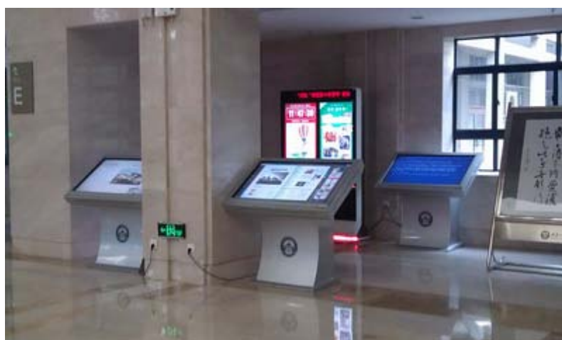
武漢大學圖書館的電子期刊閱讀設備

冊，其中 1.2 萬冊是善本，最早的是元刻本；目前因人員、技術尚未臻成熟，所以尚未進行特藏資料數位化，但為方便讀者，普通古籍可以拍照。該館參與由北京大學召集的中國高等教育文獻保障系統（CALIS）子項目的「學苑汲古：高校古文獻資源庫計畫」（ http://rbsc.calis.edu.cn ）。該資料庫是以「學苑汲古」做為對外發布和服務平臺的名稱，是一個聯合 25 所大陸、港澳大學古文獻資源的數位圖書館。資料庫內容不僅包括書目記錄，而且還可瀏覽書影或圖像式電子圖書，正進行個別合作館的文獻傳遞服務試驗，並由 CALIS 向使用者提供費用補貼。資料庫中的古文獻類型目前為各館所藏古籍和輿圖，未來將增加金石拓片等。為分享學術研究資源，本館亦介紹「中文古籍書目資料庫」，邀請該館可考量未來在此方面加強合作。