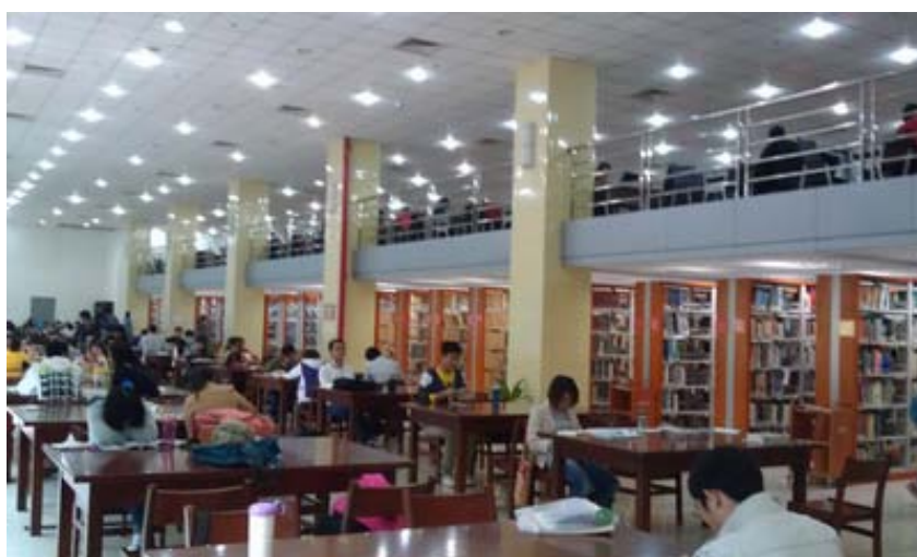
華中師範大學圖書館提供寬敞明亮的閱覽空間

該館相當重視學習和教學支援功能，圖書館網站設有「QQ 在線諮詢」及由老師和研究生維護的學科服務系統：「桂子山學術港」，此系統未來將朝引文文獻發展，發揮科學研究助理的功能；另外，新成立的「公共關係與讀者服務部」，就是為加強圖書館與顧客的關係。2012 年該館在全校師生的評鑑中，排名全校第一，可見其服務品質受到師生的肯定。