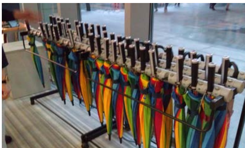
華中師範大學圖書館設置雨傘自助借還系統，供讀者使用