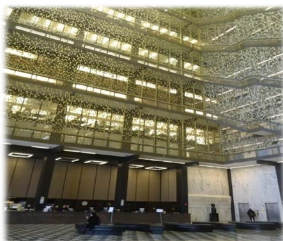
紐約大學羅博斯特圖書館 1 樓流通櫃檯