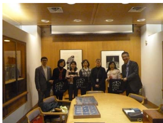
與哥大東亞館程健館長等同仁合影