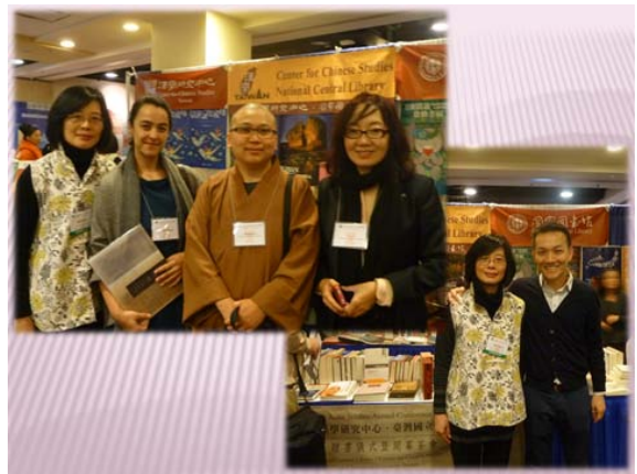
與來訪之漢學研究中心獎助學人合影