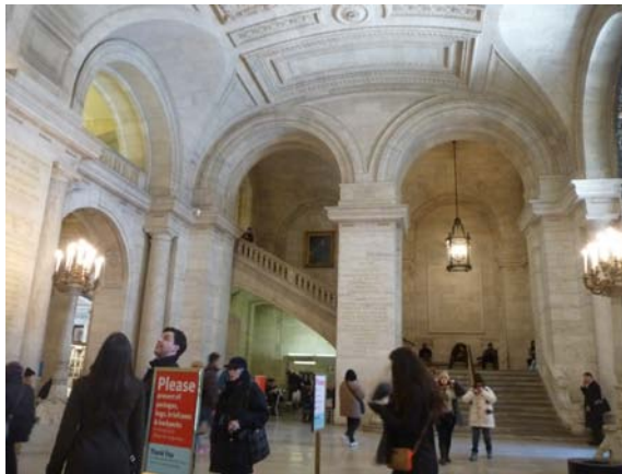
紐約公共圖書館宏偉大廳