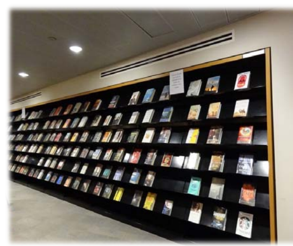
紐約大學羅博斯特圖書館-地下 1 樓暢銷書專區