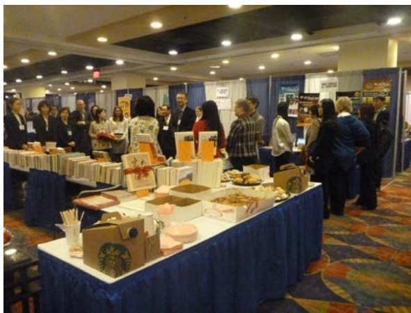
臺灣代表團歡迎茶會暨臺灣書展開幕茶會