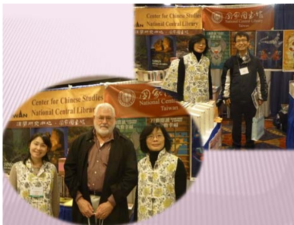
與來訪之漢學研究中心獎助學人合影