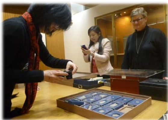
檢視哥倫比亞大學東亞館特藏—甲骨文