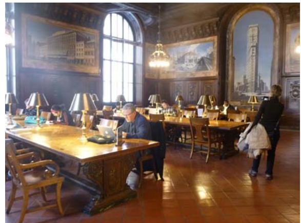
紐約公共圖書館-法學專室