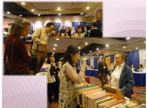
來訪學者絡繹不絕