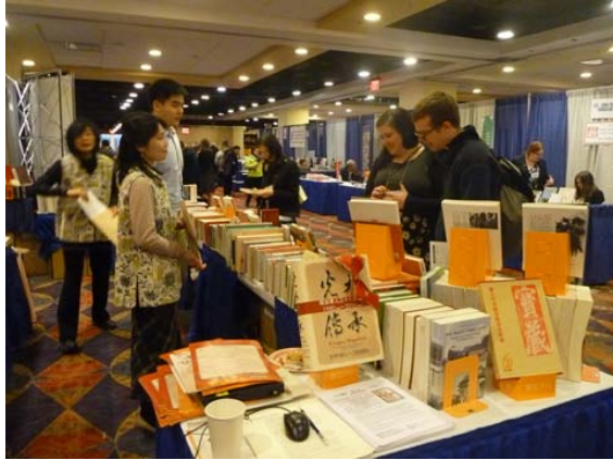
本館同仁穿著制服為來訪外籍學者解說服務