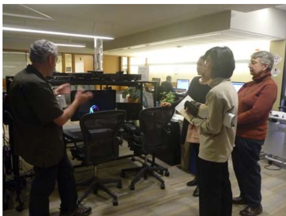
參觀紐約大學羅博斯特圖書館多媒體專室