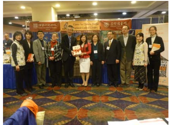
2014AAS 書展贈書會場，臺灣代表、哥倫比亞大學東亞圖書館代表、及參與盛會之學者合影