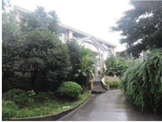
疑原重慶川東師範學校大禮堂