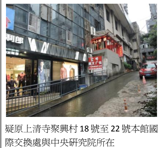
疑原上清寺聚興村 18 號至 22 號本館國際交換處與中央研究院所在