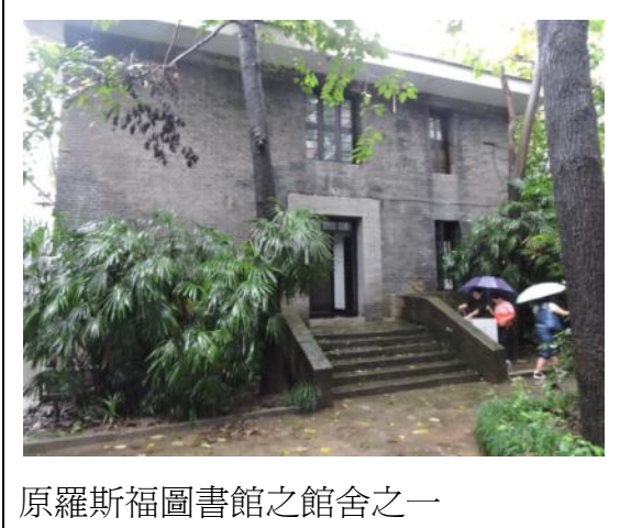
原羅斯福圖書館之館舍之一