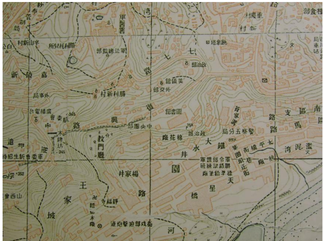
三峽博物館藏 標示本館位置 但無國立中央圖書館全銜之地圖