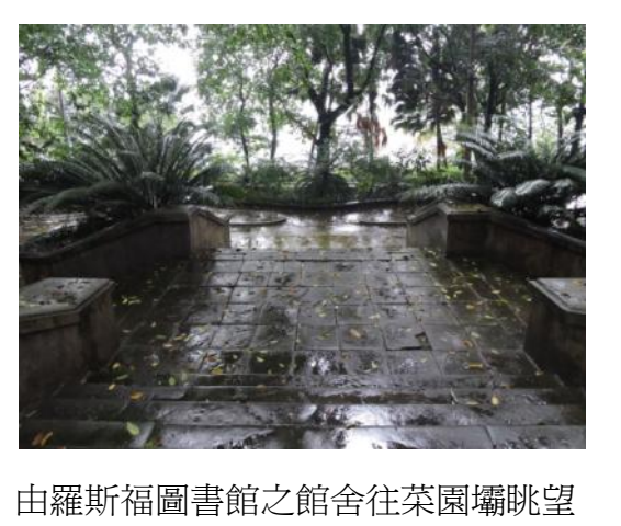
由羅斯福圖書館之館舍往菜園壩眺望