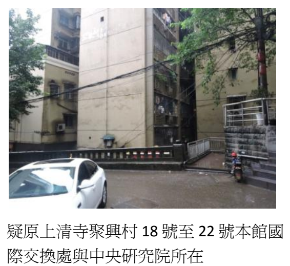
疑原上清寺聚興村 18 號至 22 號本館國際交換處與中央研究院所在