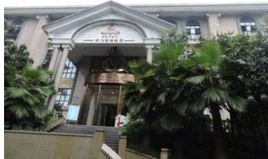
疑原重慶川東師範學校大禮堂