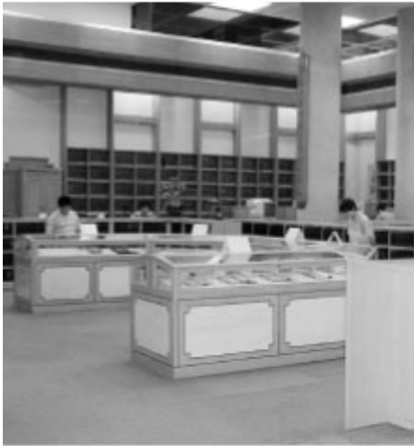
具有恆溫、恆濕的展示櫃