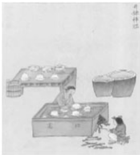
《金石昆蟲草木狀》書影