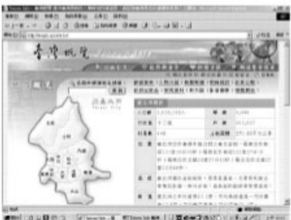
圖四 臺灣概覽系統地方概況查詢結果畫面