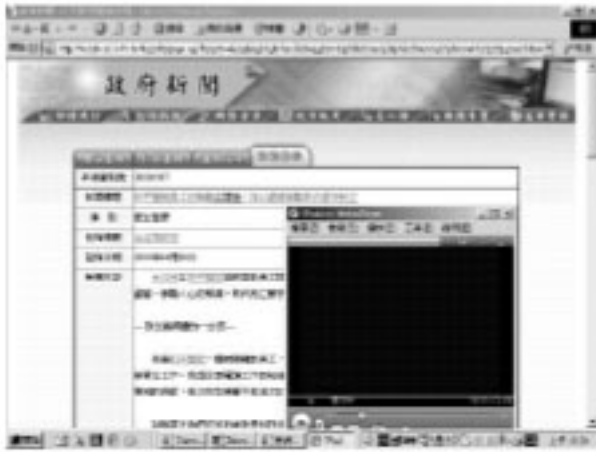
圖五 臺灣概覽系統政府新聞查詢顯示畫面