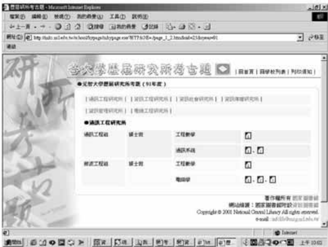
圖3：元智大學91年度資訊工程研究所考古題列表