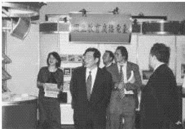
教育部長黃榮村部長巡視會場（左二）、由莊芳榮館長（右二）與俞小明主任（左）陪同解說。

展出內容主要是部屬機構二十三個館所近五年來研究成果，包括圖書、期刊、視聽、光碟資料、研究報告、出國報告、同仁著作、自建資料庫及網站等。共計一千七百五十種，二千五百冊展品參加展出，內容豐富多元。展出期間本館也印製會場平面圖及展覽簡介小冊，而各館所提供文宣資料、簡介概況、光碟、視聽資料及相關出版品於會場贈送參觀民眾。