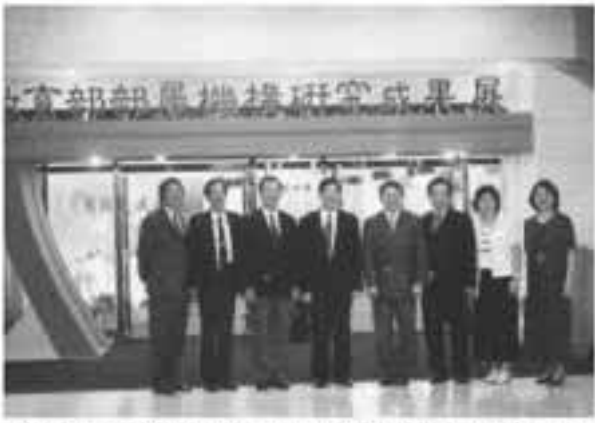
教育部長黃榮村部長（左四）偕同社教司周榛樞司長（右四）、國家圖書館莊芳榮館長（左一）、國立歷史博物館黃光男館長（右三）、國立科學工藝博物館陳訓祥代館長（左二）等人在會場合影。

為使展覽會場空間的規劃與佈置達到寬敞明亮、美觀大方的原則。這次展出地點在一樓貴賓室及三樓川堂共設置二十三個展示攤位，場地的分配依各館所提供資料量多寡而定，三樓並設置海報視聽資料展示區及視聽資料播放區，定時播放各館所提供的光碟、視聽資料。本次展覽會場主題木造拱門及弧形背板造型採用較為活潑且色彩明亮的設計，主辦單位並為每一攤位統一製作各館所簡介看板（含館舍造型及說明文字），會場外除設置組合式平面圖造型看板外，並分別在文教區地下一樓至三樓及本館中山南路外牆上懸掛本次活動的大型帆布看板相當醒目。