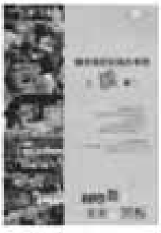
《國家圖書館遠距學園學習手冊》

國家圖書館附設資訊圖書館編輯 / 國家圖書館 / 9106 / 81頁 / 22公分 / 平裝 / ISBN 9576783402