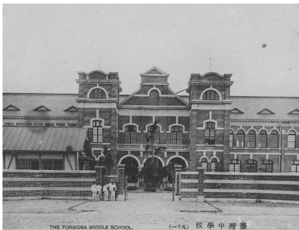
臺灣中學校，今建國中學。

以下表列出臺北地區明信片的關鍵字表，並以分類表作為分類依據，將各個關鍵字置入各類目中，不過，為了節省篇幅，將現地名刪除。