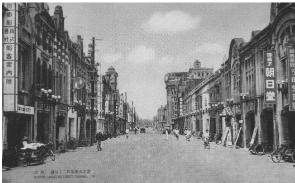
臺北市街榮町二丁目街道，即今衡陽路一帶，圖中右方街道遠處較高建築即為當時最大之菊元百貨公司。

根據這些出版者名單，我們可以了解到，發行明信片是日治時期的「全民運動」，上至臺灣總督