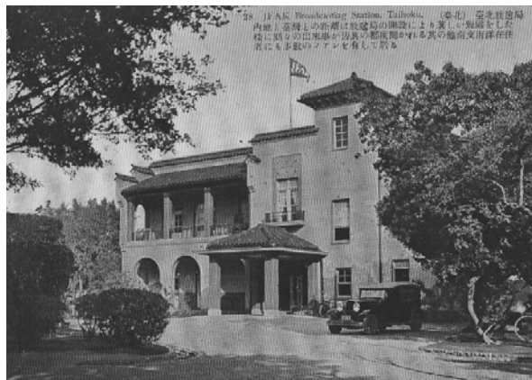
臺北放送局，位於臺北公園（現稱二二八和平公園），今二二八紀念館。

由於臺北市是日治時期臺灣的首善之區，等於是日本帝國統治臺灣的「櫥窗」，殖民者建立各種官署、街道、橋樑、公園，樹立一個殖民者熟悉的空間，並藉以向臺灣人——被殖民者誇示統治的成果，於是這些現代的建築成為值得被宣傳的物品，被印在明信片上，廣為傳佈。