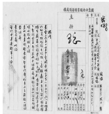
圖一 籌備時期檔案

有鑑於這批檔案的價值，期望能早日提供館內、外人士使用，以發揮最佳功效；特藏組於去（92）年著手進行整理工作，由於檔案數量龐大，先挑選重要者作初步整編，其步驟如下：1. 先去除所有釘書針、迴紋針、橡皮筋等會破壞檔案之附加物。2. 予檔案編號，每筆都給一個號，故有一檔多號。3. 建檔，含：流水號、日期（檔案日期）、簡目等，目前已完成 2 萬 4 千多筆。4. 委請廠商以彩色掃描，經校對、核正者有 1 萬 7 千多筆，已