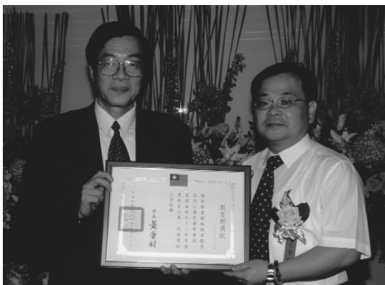
國際標準書號中心曾堃賢編輯經教育部核定為 93 年度優秀公教人員，教育部黃榮村部長（左）親自頒發獎狀（93.5.18）