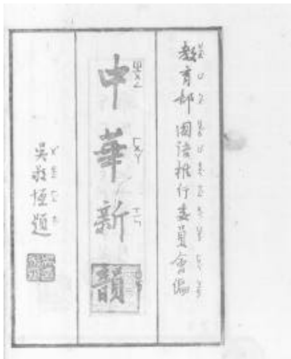
圖7 黎錦熙、盧前、魏建功等編訂之《中華新韻》朱印本, 吳稚暉先生所題之書名內封