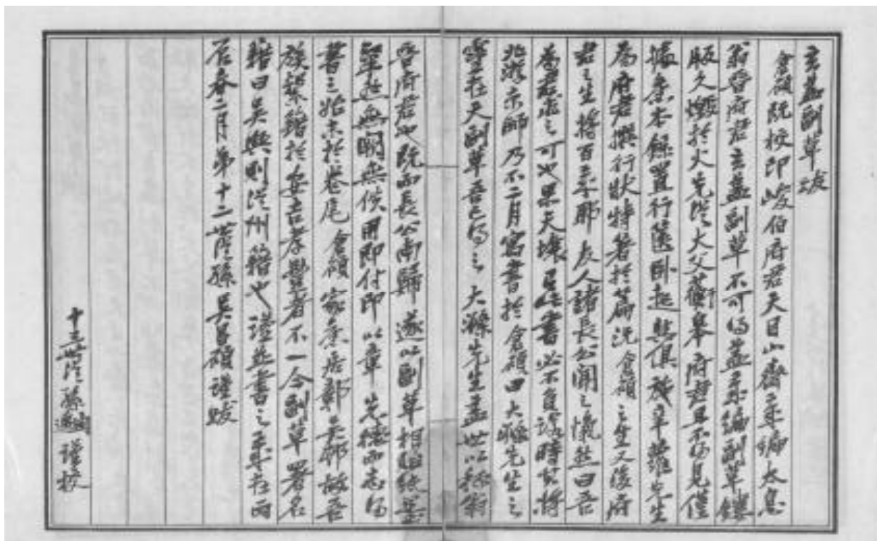
圖4 吳昌碩為重刊《玄蓋副草》所作跋文