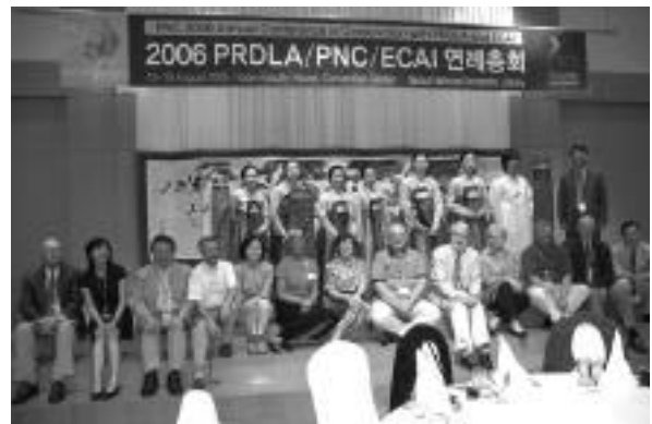
主辦單位於年會後安排之韓國傳統文化表演活動