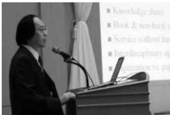
筆者於年會上發表論文

本文共分4部分，包括前言、太平洋鄰里協會年會重要議題、韓國國立中央圖書館服務概況，以及心得與感想。