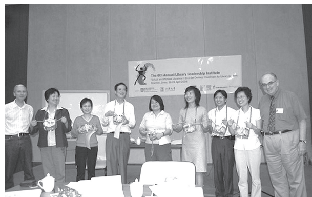
主辦單位與各組學員合影。