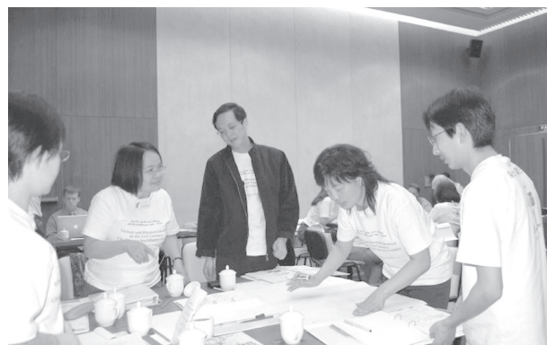
學員進行討論及海報製作。