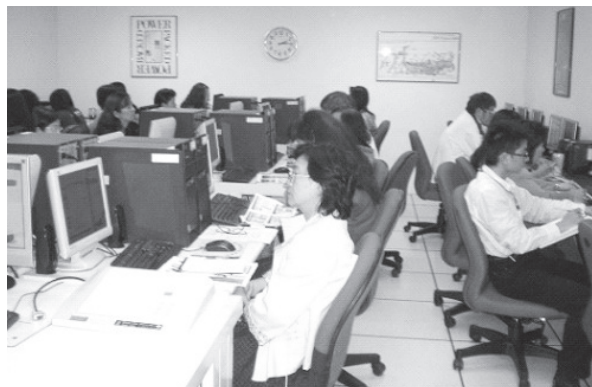
遠距學園新系統教育訓練現場實況

1 場遠距學園新系統操作教育訓練。本次訓練對象為館內同人，兩場活動共計 42 位同人參與。透過此實作的教育訓練，增進同人了解「遠距學園」新平台教學功能，熟悉學員環境的特色與操作步驟，並提升同人數位學習能力與圖書資訊服務品質。(閱覽組陳澄瑞)