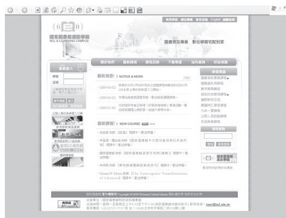
遠距學園新系統首頁

本館「遠距學園」為提供學員更佳之承載量與閱讀效能，已於今（98）年3月完成系統平台轉換與升級作業，學園除提供系統原有之功能外，並新增以下特色功能，包括：一、學員個人化學習管理，如提供個人化介面、個人行事曆、個人筆記本及專屬的學習功能區等；二、學習互動功能，如線上學習社群討論機制；三、教學資源查詢功能，讓學員閱讀特定課程時，亦能掌握該課程之相關參考資源，如國家圖書館藏書目、全國圖書書目、網路書店及網路資源…等，以期便利學員擴充利用與課程主題相關之數位學習資源。