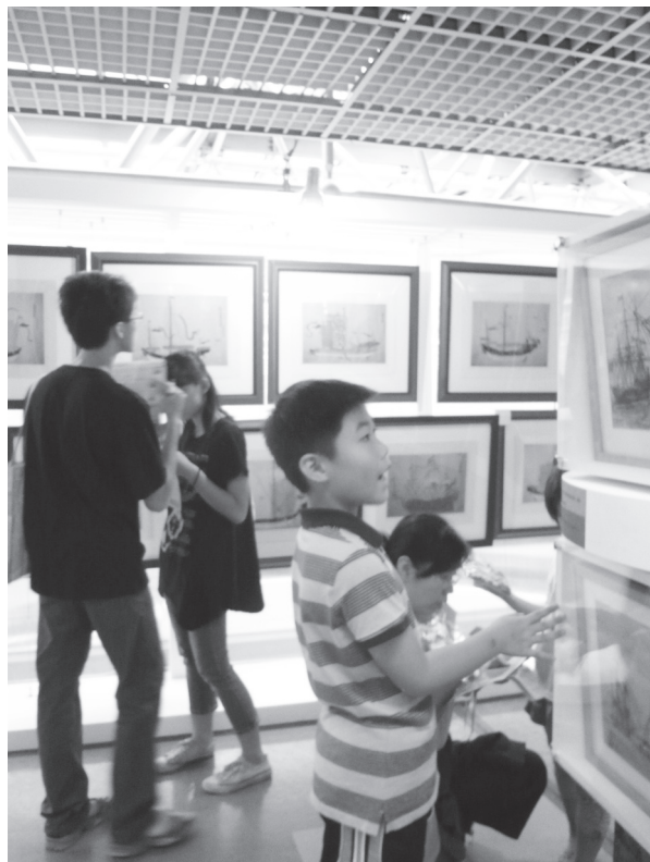
配合問題單，小朋友小心翼翼地轉動船圖找答案。

http://www.edu.tw/files/site_content/EDU01/ 教育部施政藍圖 __1_1.pdf