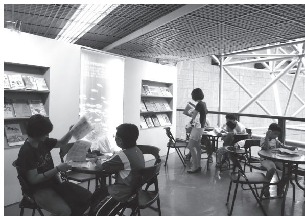
歇一下，充實海洋相關知識。