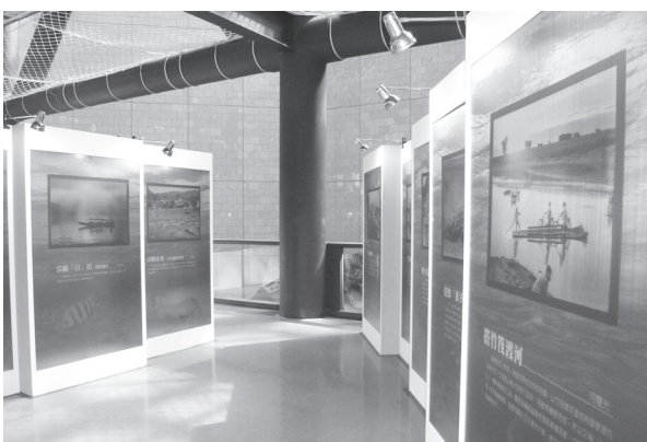
何慧光先生攝影作品，欣賞其作宛如步入時光隧道。

「古船圖」為17世紀與日本通商的中國各地古船，包括台灣船、廣東船、南京船……等，異國船隻圖，內容多為歐美船隻，按照原船比例縮小且色彩鮮艷。「漁村攝影作品」是「慧光攝影器材公司」創辦人何慧光先生於1950~1960年間用鏡頭紀錄農漁村生活，舉凡農漁民的作息、居住房舍、衣飾到廟會活動等都一一入鏡，此次選取與海洋、海港的相關照片輸出，讓參觀者在港都中不只看到現在高雄的美，同時透過攝影資料可回味往昔的漁港樣貌，見證時代的變遷，令人不禁昇起懷舊之情。