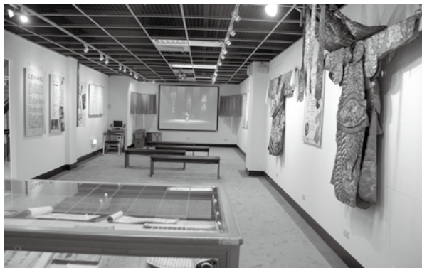
「天官賜福」展示廳一隅。