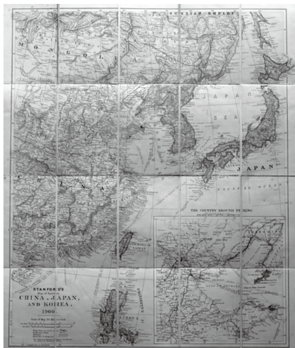
1900年倫敦 Edward Stanford 出版之「Stanford's Map of Eastern China, Japan and Korea」。