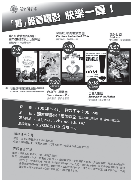
國圖設計精緻宣傳海報，深獲民眾好評。