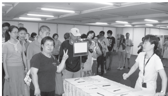
熱情民眾等候進場觀賞「珍奧斯汀的戀愛教室」。