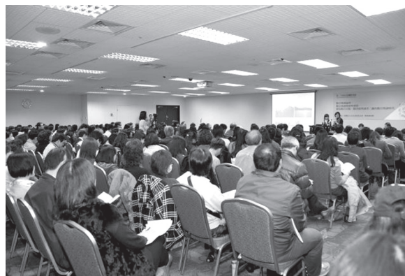
「數位出版暨閱讀論壇」報名踴躍, 會場座無虛席。

而現場參觀者更可以其本身之智慧行動載具拍攝 OR Code, 以下載古籍電子書, 進一步呼應本次環保、數位閱讀的主軸。