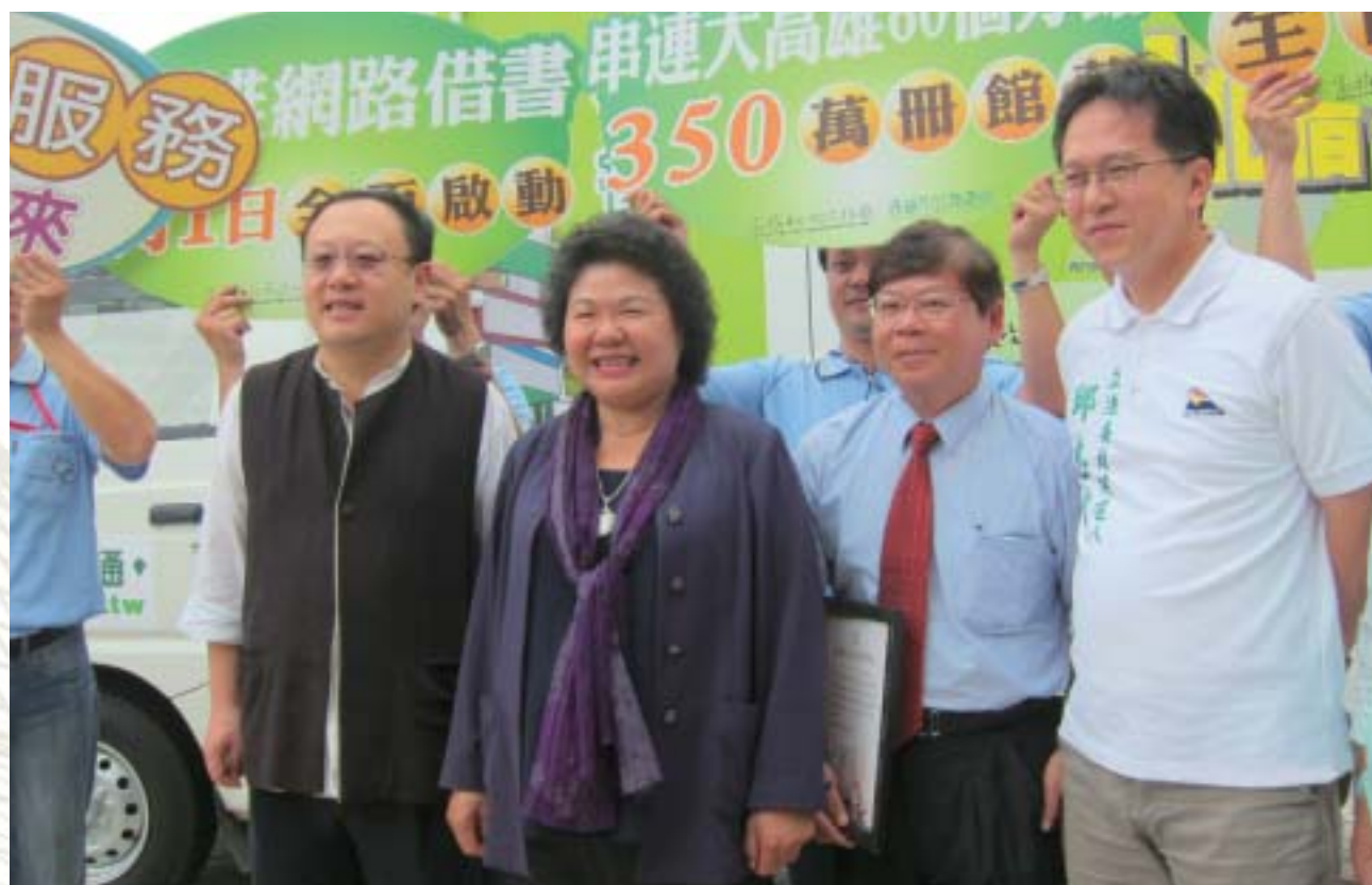
● 100年6月參加大高雄網路借書服務全面啓動記者會

非常感謝大家對於我在地方推動圖書館建設的肯定，這個榮譽也要歸功於巿府團隊。本人自上任以來，特別重視圖書館建設，任內完成6所新館，未來2年，也將啓用8所，其中最受矚目的是位於亞洲新灣區新圖書總