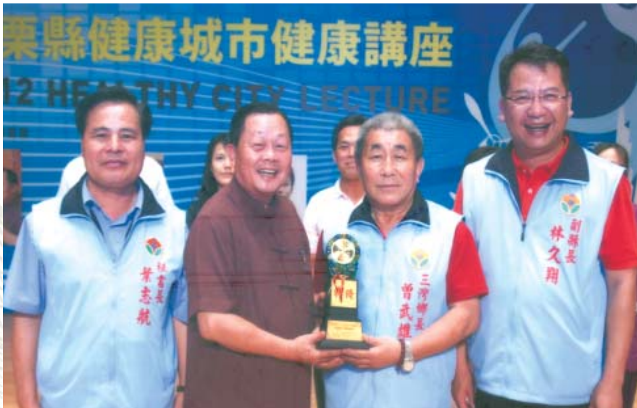
● 101年鄉長接受縣長表揚100年公共圖書館營運績優一特優獎

感謝主辦單位（國家圖書館）給予的肯定，武雄在此致十二萬分的謝意，同時也感謝教育部、苗栗縣政府等上級機關，不論在經費、人力參與等方面的支持；爾後「三灣圖書館」將繼續努力，擴大服務項目與層面，