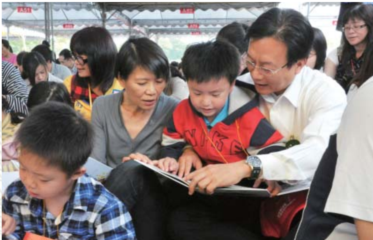
● 100年4月世界書香日親子共讀

彰化縣建縣近三百年，文風鼎盛，原有的舊詩社、藝文團體甚夥，新文學的推動從日治時期開始就已經是全臺的領導核心，伯源深知古人所言：貧者因書而富，富者因書而貴，領導縣政以來，即以延續傳統，深耕