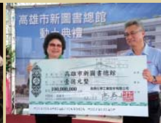
● 101年10月長興化工支持興建新總館捐助1億元