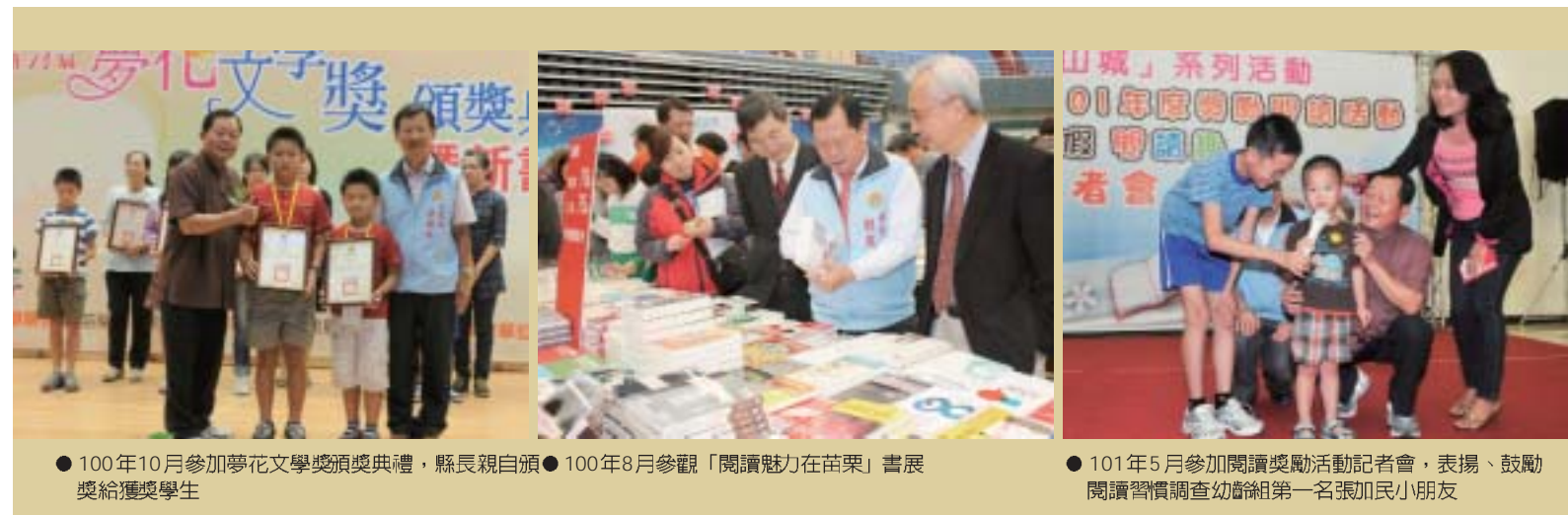
● 100年10月參加夢花文學獎頒獎典禮，縣長親自頒獎給獲獎學生 ● 100年8月參觀「閱讀魅力在苗栗」書展