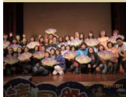
● 100年11月參加全國故事媽媽大會師活動