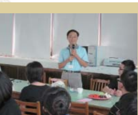
●黃館長以簡報、座談方式向參訪團體介紹圖書館

招募志工及爭取贊助，善用社區資源發展圖書館業務，成效顯著；推動各項中央補助計畫，能創新服務內容並積極辦理閱讀活動，成果卓著；圖書館營運績效評鑑連年獲臺中市（前臺中縣）評比第一名，在資源不足之鄉鎮圖書館，殊為難得。