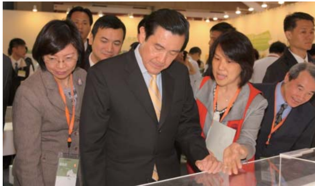
● 101年2月，於臺北國際書展綠色閱讀主題館舉辦「悠遊天下——明代文人的樂活方式」古籍展，曾館長陪同馬總統參觀特展，俞主任負責為其導覽說明

一、100年及101年規劃「發現古人生活美學」、「悠遊天下——明代文人的樂活方式」、「千古風流人物——蘇東坡」等古籍特展，其中於臺北國際書展綠色閱讀主題館舉辦之「悠遊天下——明代文人的樂活方式」古籍展，首次將國圖古籍原件運至館外展出，突破傳統作為值得讚賞；另規劃「博雅——閱讀古人生活美學