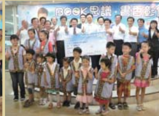
● 98年8月BOOK思讀·書香彰化購書禮讚記者會

文化為首要目標，「與書為友，天長地久」，將繼續推廣閱讀，扎根基層，為培育彰化人才、國家棟樑而努力。