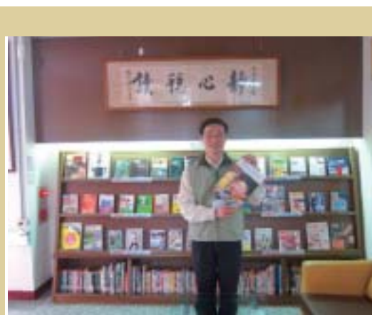
●大安圖書館專門為爸爸設置「寵愛爸爸專區」，提供理財、休閒等書籍