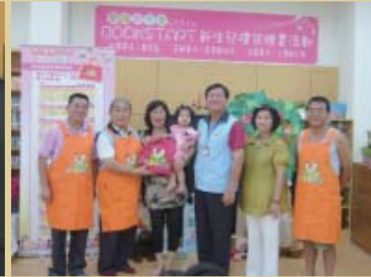
● 鄉長參加101年新生兒禮袋贈書活動與鄉民合影