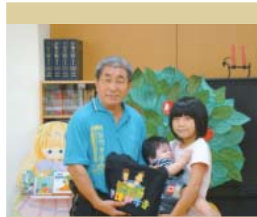
● 鄉長參加100年新生兒禮袋贈書活動與小朋友合影