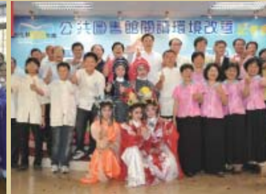
● 100年度閱讀環境改善，專款補助8000萬元啟動記者會