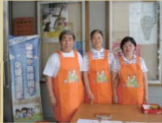
● 101年鄉長到圖書館擔任一日志工

以圖書館為中心向外輻散更優質的閱讀視野，有效提升鄉民人文素養與文化品質、縮短城鄉差距。我們堅持唯有「閱讀動起來，希望才會跟著來」。