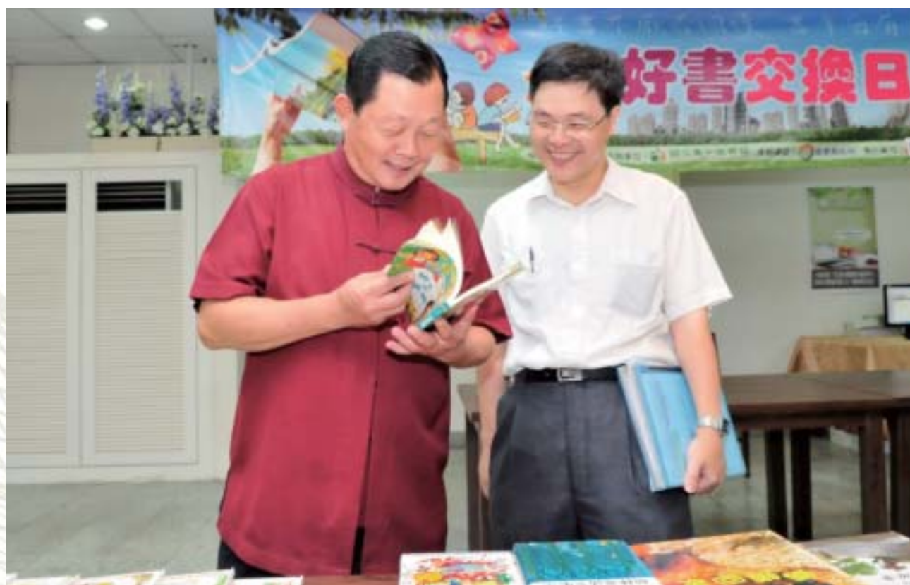
● 100年7月參加好書交換日活動

公共閱讀是基礎建設中的重要一環，圖書館在此扮演關鍵角色。一如對教育事業的重視，苗栗縣府團隊不遺餘力地推動公共圖書館事業。此番非常榮幸能獲獎譽，今後苗栗縣也將繼續深耕公共圖書館閱讀、並持續