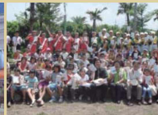
● 96年4月參加「開心築讀書會」與市長讀書活動

館，預計103年底完工營運，這是一座讓高雄巿引以為傲的文化新地標，希望各界繼續給予支持與指教！