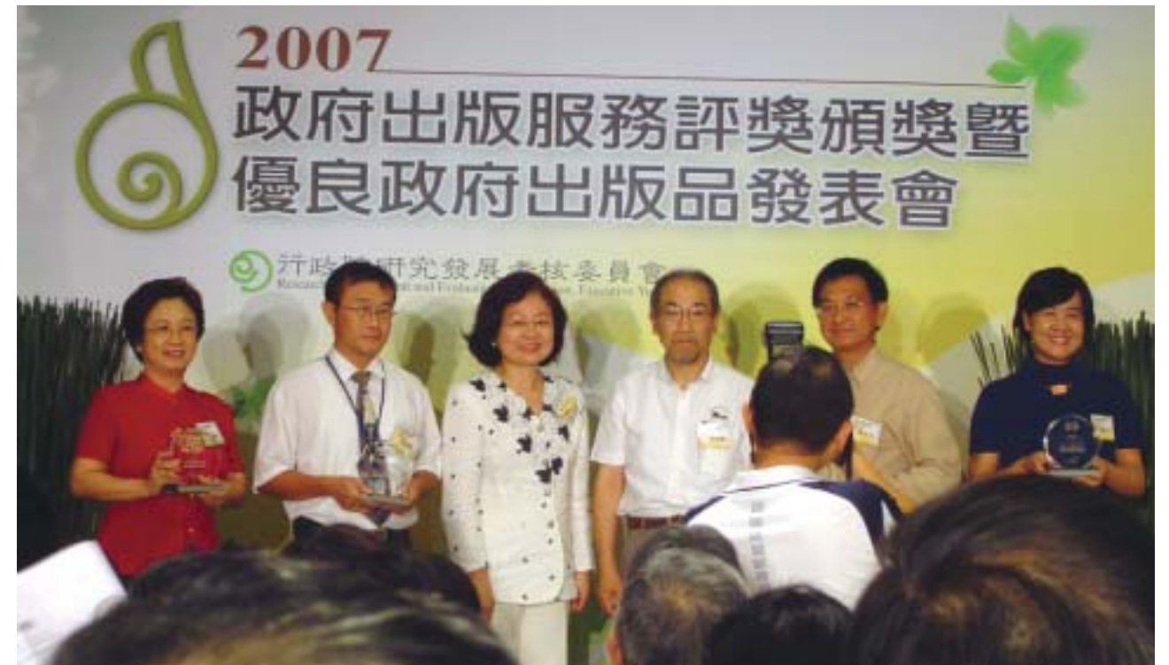
●承辦「澎湖褒歌」網路教材，獲優良政府出版品殊榮