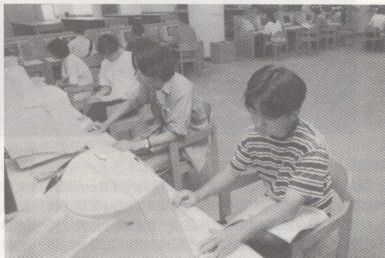
三樓參考室內設有網路資源檢索區