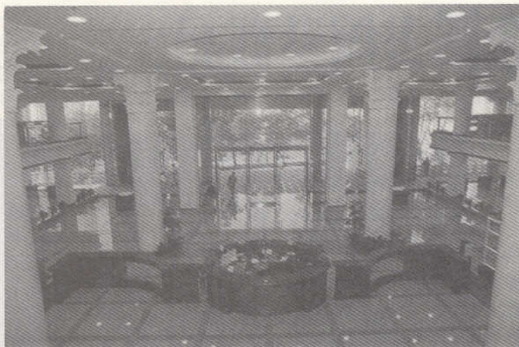
透通的門廳象徵無牆的圖書館