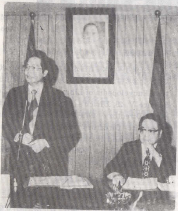
教育部施次長在本館遷建委員會會議致詞。

目前本館正根據遷建委員會決議擬訂公開徵圖辦法，近期內報請教育部核定後即可進行其事。