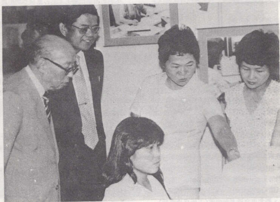
嚴前總統家淦先生及研考會主任委員魏鏞先生參觀本館自動化作業展示說明

三天的展示會期間，吸引眾多的民衆參觀，前總統嚴家淦先生、行政院孫院長、及教育部朱部長等首長均蒞場參觀，許多民衆對書目查詢作業均甚感興趣，本館將更積極進行全國書目資料建檔工作，以期早日開放對讀者服務。