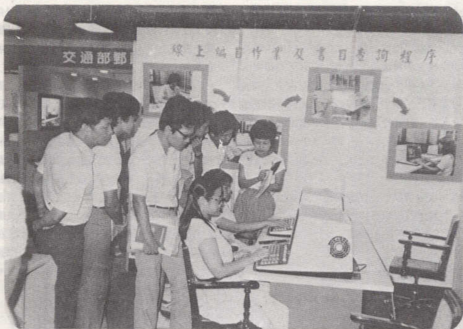
本館展示線上編目作業及書目查詢程序