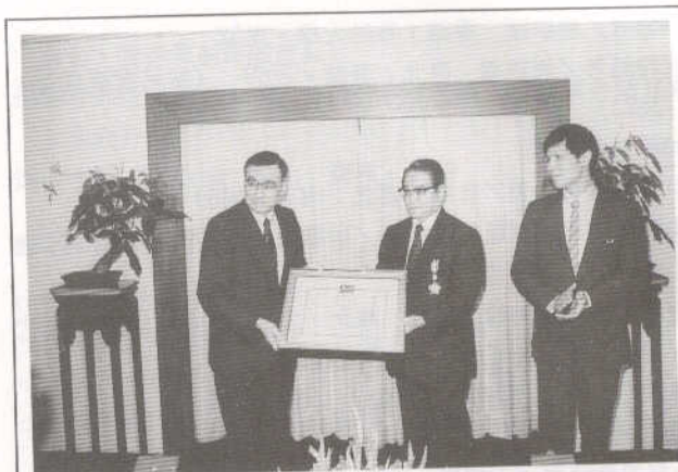
王館長獲頒行政院功績獎章

此外，「圖書館法」及「圖書館標準」也相當重要。我們已就「圖書館法」努力了很多年，我也是圖書館法委員會的召集人，開過好多次會，而且已有初步的草案，不過草案的文字和內容上還需要慎重斟酌，所以特別邀請法律專家再加以研究，希望「圖書館法」不只將目前現有法規加以合併，而更能發揮積極的作用，至少對圖書館專業的精神、專業的地位，甚至人員、經費，以至於圖書館的功能等等都能有明確的規定。但是這個法的訂定涉及到其他法令如社會教育法、大學法、高中法、人員經費的法令等等，彼此不能有所抵觸，當然為了維護圖書館界的發展與權益，某些方面必須堅持，但是我們也不希望這個法有太多的阻礙而不能通過。另一個是「圖書館標準」，教育部曾計劃研訂各級圖書館標準，但是在人員編制方面仍多問題，這一點雖然我們在圖書館標準裏有明確的規定，但是始終無法突破現行人事法規的一些障礙。目前各位手邊的標準是民國68年所訂定的，距今已有7、8年之久，可能有許多不切合時代需求之處，我個人建議圖書館學會應以專業的立場立即公布各級圖書館合理的經營標準。大家集思廣益，研訂出怎樣才是合理的編制、合理的經費，雖然不具約束力，但大有助於邁向圖書館專業化的目標。因為這可以給學校行政主管、教育行政當局以及社會各界確實了解經營一個圖書館需要什麼條件，一個理想的圖書館需達到什麼要求。假如大家同心協力，我估計一年