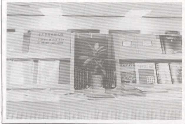
中美教育交換40週年紀念展

出席，會議主題主要討論臺灣及中國大陸之政治、文化、經貿及法律等問題，本館參展之書刊頗能配合主題，加以內容新穎、印刷精美，確能吸引與會學人之注目，紛紛前來參觀，學人們對於本館挑選參展書刊，愛不釋手，或即訂購、或表示携回書目交所屬圖書館洽購，本館工作人員亦陪同解說並接受訂購。該會特頒感謝狀表彰本館近年來赴美配合年會舉辦書展之貢獻，展後贈書給喬治華盛頓大學中蘇研究所典藏。