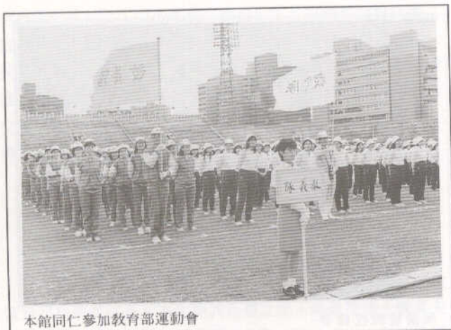
本館同仁參加教育部運動會