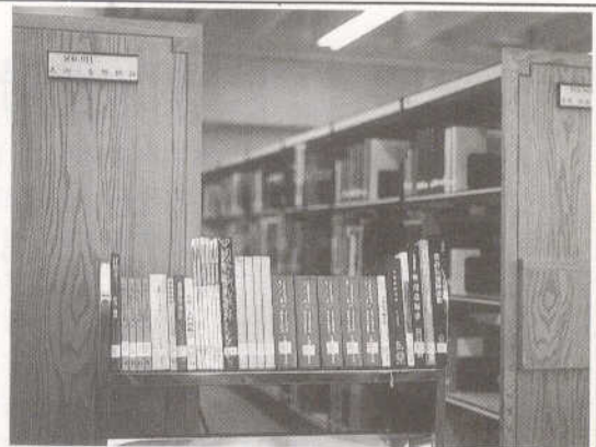
本館美術室自2月29日起增加音樂及攝影類圖書，歡迎讀者逕往參考利用