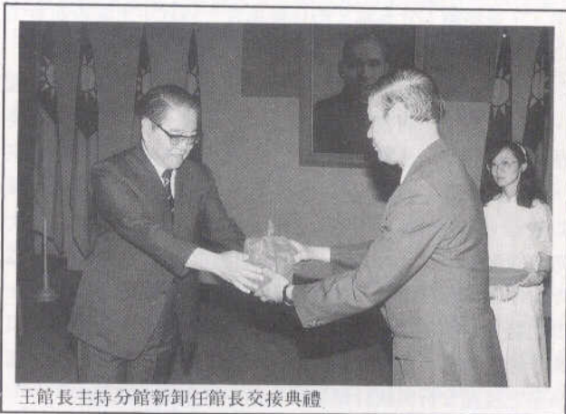
王館長主持分館新卸任館長交接典禮

發展尚付闕如。而此時正值政府推動文化建設，各級圖書館事業勃興之時期。諸如各館館舍之興建、圖書館自動化之推動、圖書館教育與圖書館學研究之提昇、館際合作的發展等。因此，年鑑的續編至為必要。然而，此時亦值國立中央圖書館新建館舍並遷移，諸事繁多，年鑑的續編工作雖在進行，不免受到影響而稽延。新館開放啓用後，即積極進行編撰工作。