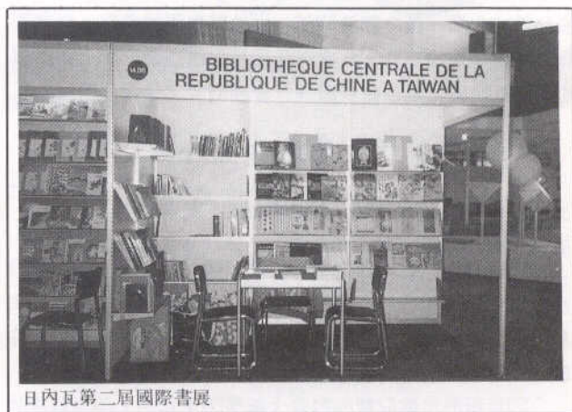
日內瓦第二屆國際書展

本館於今年度首次參加在瑞士舉行之日內瓦第二屆國際書展（2 ème Salon International du Livre a Geneve），特精選書刊114種147冊，另印製精美展覽目錄，一併送請我國駐瑞士孫逸仙中心代為辦理展出事宜，展覽時間自5月11日至15日，共展出5天。由於事前準備充分，並經該中心積極規劃，熱心聯絡與注意交涉，展出效果極為良好；展出期間我國館觀衆絡繹不絕，訂書總量超過兩百冊，所備訂書單全部用罄，一般觀衆多認為我國館展品印刷精美，充分反映我國固有文化，可稱是一次成功的文化交流活動。透過本次書展，使我國文化傳佈在歐洲又多一據點，本館今後當更加強展覽效果，使國內出版狀況及學術文化進步情形，傳播於海外。