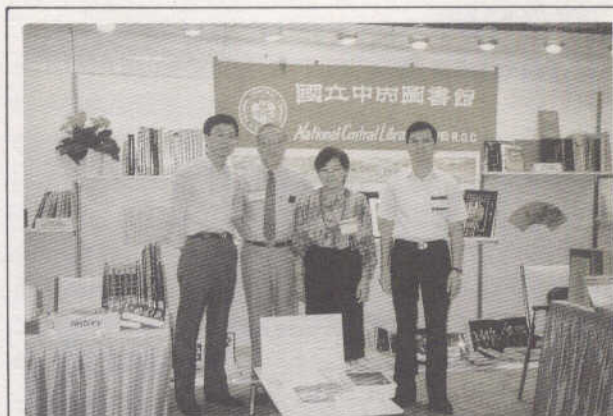
本館參加美國圖書館協會107屆年會書展

美國圖書館協會第 107 屆年會於 7 月 9 日至 14 日，在美國南部臨墨西哥灣之路易斯安那州紐奧良市舉行。9 日至 12 日同時辦理國際書展，展覽會場設在紐奧良市會議中心。參加展出的國家除我國外，尚有：英國、法國、韓國、