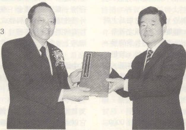
馬漢寶教授(左)捐贈其先尊翁馬壽華藏書暨文獻資料予國家圖書館，由曾館長代表接受

配合慶祝國家圖書館 63 週年館慶暨國立中央圖書館易名為國家圖書館，前大法官馬漢寶教授特將其先尊翁馬壽華先生藏書暨文獻資料移贈國家圖書館。此次捐贈內容，包括：個人手稿、紀念性照片、知交手札、學者題贈之書籍、書畫名家題贈之作品原件及刊印之冊集等三百餘件。