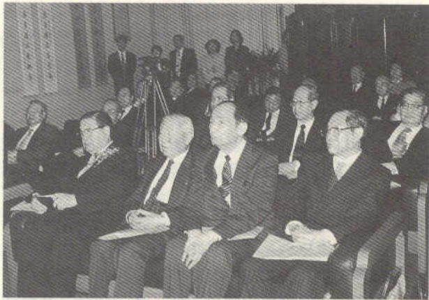
捐贈儀式於本館貴賓室舉行，嘉賓雲集

馬壽華先生字木軒，號小靜，早年曾任各級法官、南京市政府秘書長，來臺後先後擔任司法院秘書長、行政院院長、公務員懲戒委員會委員長，退休後受聘為國策顧問。先生自幼嗜愛書畫，功力甚深，於書法工行楷，行書特秀逸溫潤，畫則善山水、花卉，尤工墨竹，復精指畫，自成一派。民國 49 年榮獲國家文藝獎之美術獎。先生與藝文界人士廣結翰墨之緣，二次大戰前在上海時期，即與夏敬觀、譚澤闓、馮超然、吳湖帆、沈尹默、黃賓虹、余紹宋等書畫名家過從甚密，談書論畫。來臺後於政務之餘，與陶芸樓、陳方、鄭曼青、高逸鴻、張毅年、劉延濤諸君子作書畫雅集，號稱七友畫會，因而留下不少自民國初年以來，政壇積學之士如：呂必籌、王文豹、許崇智、王世杰、王雲五等人之手札，上述書畫名家之作品以及各界有紀念性之照片，凡此均蘊藏著現代史及美術史的重要資料。此外，先生於 70、80 壽慶，及與夫