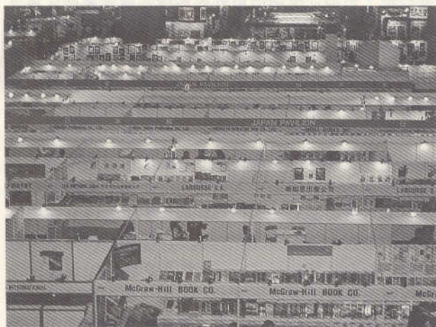
第五屆臺北國際書展於世貿中心盛大舉行

「第五屆臺北國際書展」共有來自國、內外34個國家及地區，588家出版社，計1,316個攤位參展。其規模之大，不僅是中華民國有史以來最大的書展，同時也是世界第四大的書展，因此引起不少國際專業人士的注意。這次共有14位主要書展及出版團體