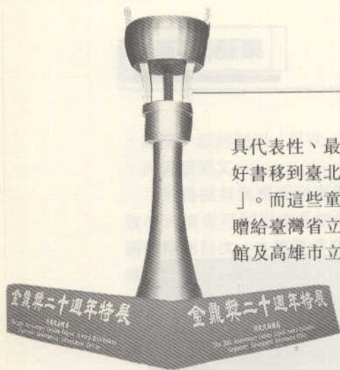
書展專題區之一： 金鼎獎20週年特展

具代表性、最好的2千多本競賽書及得獎好書移到臺北展出的「波隆納書展在臺北」。而這些童書在展完後，將由新聞局轉贈給臺灣省立臺中圖書館、臺北市立圖書館及高雄市立圖書館。