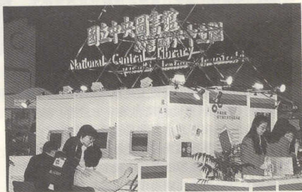
本館攤位展出本館與漢學中心之新近出版品(上圖)以及多項資訊檢索系統(下圖)