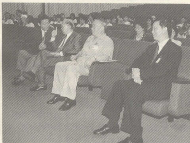
人文館際合作組織第15屆年會於故宮博物院舉行，前排左起曾館長、秦孝儀院長、昌彼得副院長、吳哲夫處長

本次會議通過三項建議：一、建請教育部發函所屬大專院校及社教機構，將其出版之期刊或學報，授