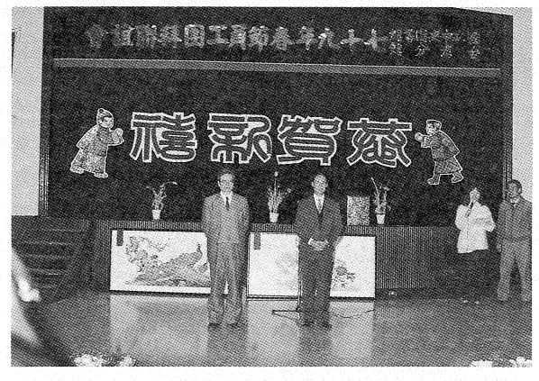
臺灣分館春節團拜

會議，本次會議重點除作館藏臺灣文獻書目解題編纂出版情形業務報告外，委員們並就各冊編纂體例交換意見。