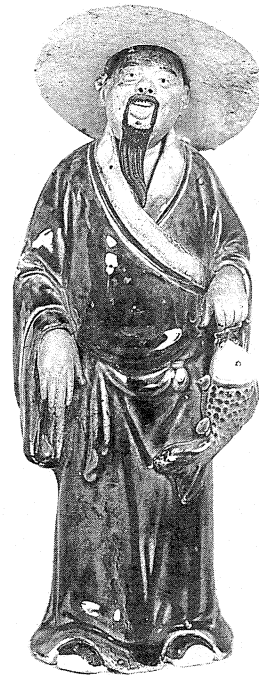
民國石灣窯綠釉漁翁立像