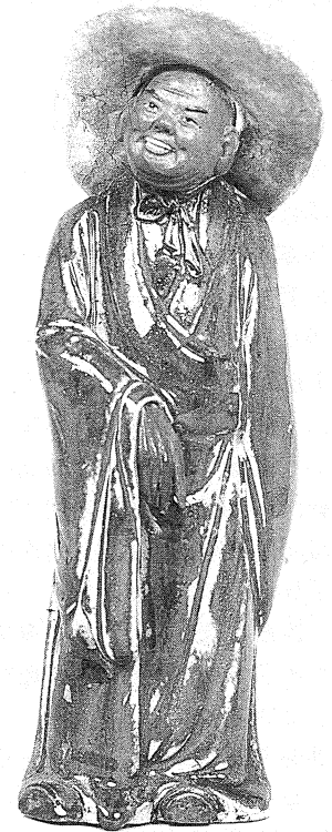
民國石灣窯石榴紅釉漁翁像