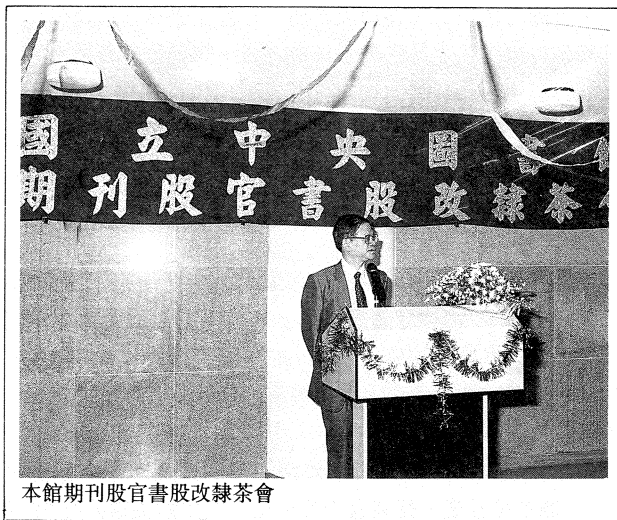
本館期刊股官書股改隸茶會

大體而言，圖書館書刊進館作業流程，係先經採訪組負責選擇、採購及登錄，再由編目組進行分類與編目，最後將書刊送至閱覽組，提供讀者閱覽與參考服務，各組各司有專責，分工合作。過去由於期刊及官書(即政府出版品)二股業務性質較為特殊，且進書數量龐雜，因此劃歸採訪組，其目的在謀求資料徵集與管理之便利。但就讀者服務之實務而言，難免會有事權不一之缺失，本館為改進其缺失，因而研議二股改隸之可行性。此項改隸革新措施，決策之過程甚為審慎，最初由館長指示，就本館性質、讀者需求、未來發展方