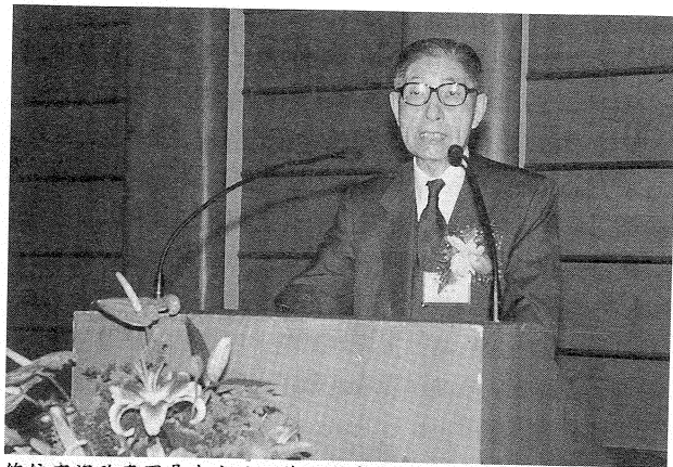
總統府資政李國鼎先生於開幕典禮專題演講